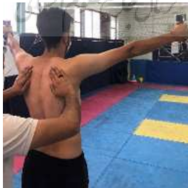
تصویر ۱. آزمون دیسکنزی کتف برای تعیین نوع دیسکنزی کتف