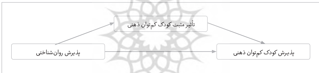
شکل (۱) مدل پیشنهادی پژوهش

نسبت ۱۵ تعداد نمونه به تعداد متغیرهای مستقل بود. با توجه به ۲ متغیر مستقل که در مجموع شامل ۱۱ خرده‌مقیاس نیز می‌شد، با ضرب عدد ۱۳ در ۱۵، به تعداد حجم نمونه‌ای برابر با ۱۹۵ رسیدیم و با توجه به احتمال ریزش نمونه‌ها، در مجموع ۲۰۰ نفر برای شرکت در پژوهش انتخاب شدند. برای سنجش متغیرهای پژوهش از پرسشنامه‌های استاندارد استفاده شد. ملاک‌های ورود به پژوهش شامل: داشتن فرزند کم‌توان ذهنی براساس اسناد پزشکی و روان‌پزشکی، سطح تحصیلات حداقل دیپلم مادر، رضایت‌نامه آگاهانه و آمادگی جهت شرکت در پژوهش و زندگی هر دو والد با هم (عدم طلاق یا فوت یک والد). ملاک‌های خروج شامل: عدم رضایت ادامه پژوهش و عدم داشتن سابقه اختلال روان‌پزشکی یا مصرف داروهای روان‌پزشکی بود. نتایج با استفاده از نرم‌افزار SMART_PLS3 مورد تجزیه و تحلیل قرار گرفت.