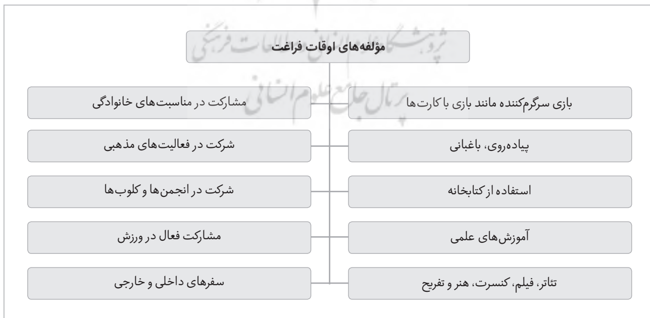
جدول (۱) مؤلفه‌های اوقات فراغت از نظر اوتز و همکاران (۱۰)

۶) ویژگی‌های محیط خانه: یکی دیگر از مؤلفه‌های مؤثر در انتخاب و ارائه فعالیت‌های اوقات فراغت، ارزیابی محیط خانه و محله از نظر سن والدین فرد، وجود خواهر و برادر یا سایر خویشاوندان و نگرش اعضای خانواده است. این مؤلفه‌ها به‌طور جدی استقلال فرد و انواع فعالیت‌هایی را که او می‌تواند در آن مشارکت کند، تحت تأثیر قرار می‌دهند (۲۰).