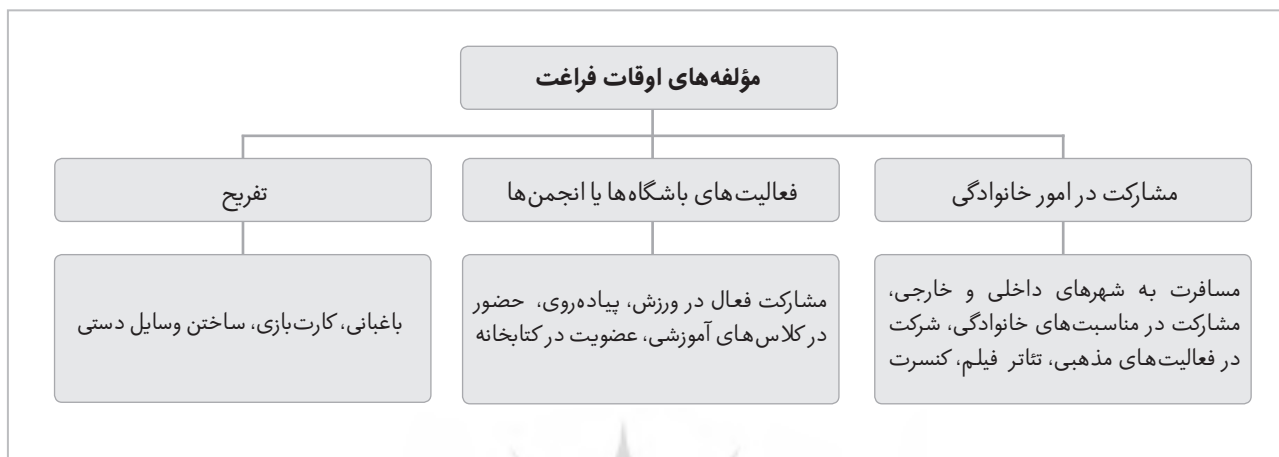
جدول ۳) مؤلفه‌های اصلی اوقات فراغت از نظر گو و همکاران (۲۲)

هدف اصلی فعالیت‌های اوقات فراغت به نحو خاصی به هوش و درخواست‌های اجتماعی یا میزان فعالیت جسمی توجه دارد. وجود هماهنگی و همخوانی بین فعالیت‌های جسمی و توانایی شناختی در سنین مختلف و در پژوهش‌های مختلفی تکرار شده است (۲۹). پگان رودریگز (۷) برنامه‌های اوقات فراغت در بزرگسالان دارای ناتوانی را به ۳ بخش کلی تقسیم کرده که در جدول (۴) آمده است.