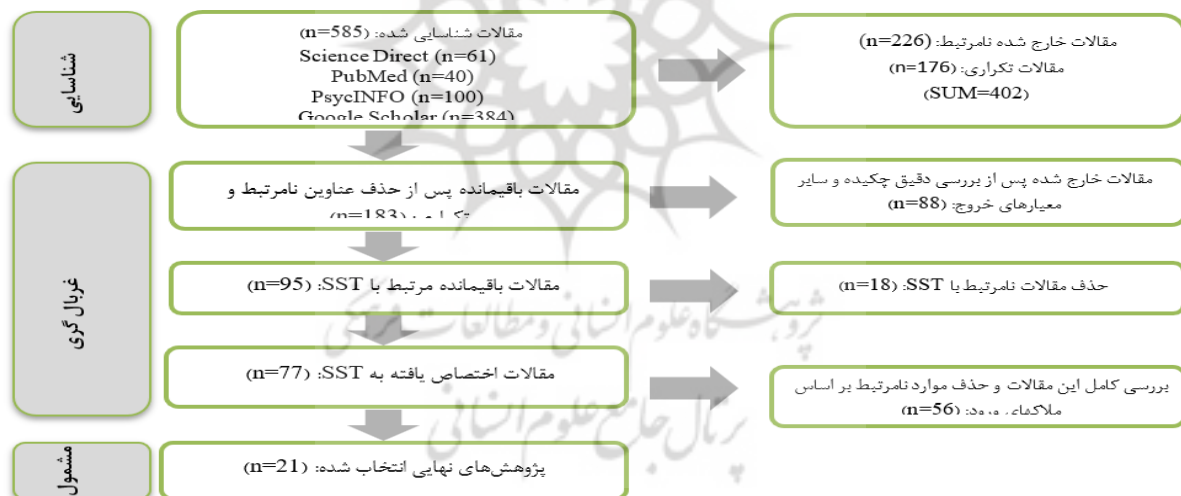
شکل ۲. فرایند گزینش مطالعات

در جدول (۱) خلاصه‌ای جامع از این مقالات گزینش شده آورده شده است: