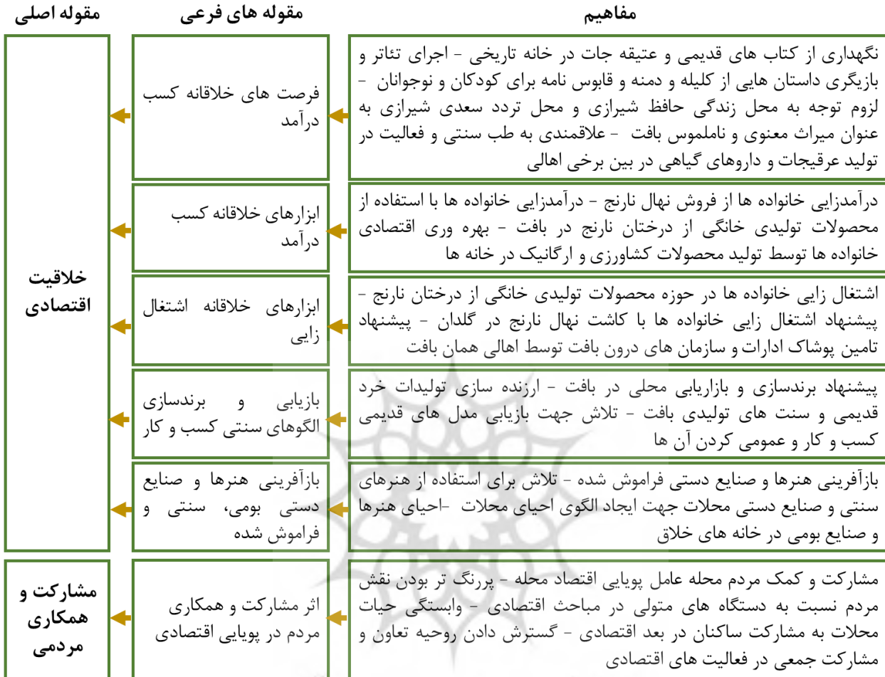
نمودار ۷: راهبردهای الگوی توانمندسازی اقتصادی بافت تاریخی شیراز

❖ راهبردهای الگوی توانمندسازی اقتصادی بافت تاریخی شیراز راهبردها کنش یا برهم کنش‌های خاصی هستند که از پدیده محوری منتج می‌شوند. راهبردهای توانمندسازی