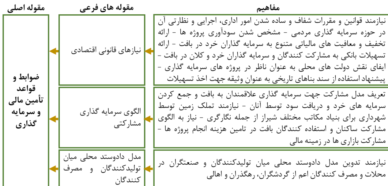
نمودار ۵: شرایط زمینه‌ای الگوی توانمندسازی اقتصادی بافت تاریخی شیراز

❖ شرایط مداخله‌ای الگوی توانمندسازی اقتصادی بافت تاریخی شیراز شرایط مداخله‌ای مجموعه علل و شرایطی است که کنشگر را به انجام رفتار خاصی ترغیب می‌کند و بر راهبردها نیز مؤثر است. عوامل مداخله‌ای الگوی توانمندسازی اقتصادی بافت تاریخی شیراز از دیدگاه مصاحبه‌شوندگان و نتایج حاصل از مقوله‌بندی کدها در نمودار زیر ارائه گردیده است.