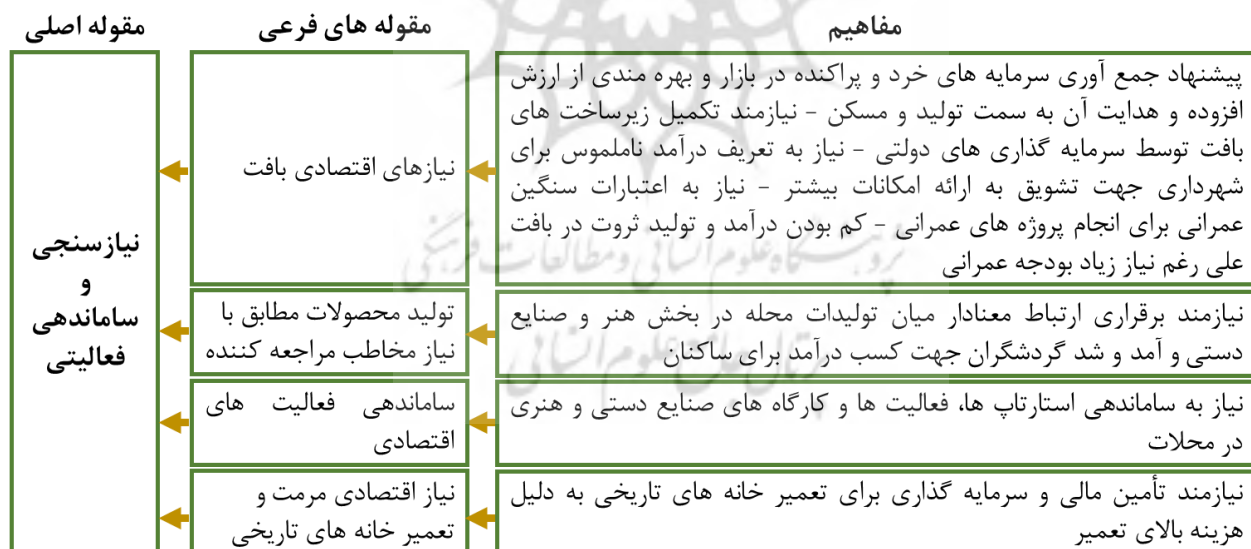
نمودار ۶: شرایط مداخله‌ای الگوی توانمندسازی اقتصادی بافت تاریخی شیراز

❖ شرایط مداخله‌ای الگوی توانمندسازی اقتصادی بافت تاریخی شیراز شرایط مداخله‌ای مجموعه علل و شرایطی است که کنشگر را به انجام رفتار خاصی ترغیب می‌کند و بر راهبردها نیز مؤثر است. عوامل مداخله‌ای الگوی توانمندسازی اقتصادی بافت تاریخی شیراز از دیدگاه مصاحبه‌شوندگان و نتایج حاصل از مقوله‌بندی کدها در نمودار زیر ارائه گردیده است.