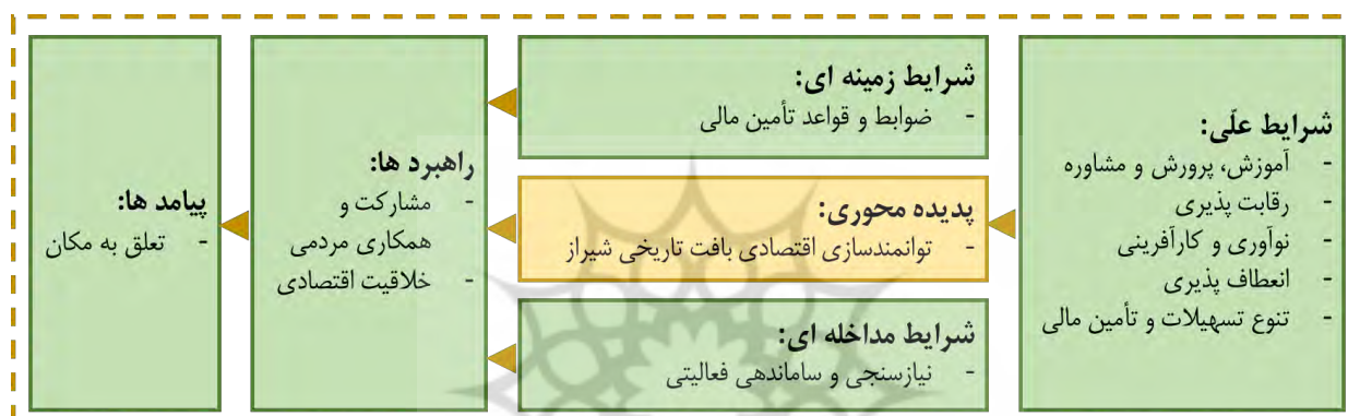
نمودار ۹: الگوی توانمندسازی اقتصادی بافت تاریخی شیراز

«ضوابط و قواعد تأمین مالی» به عنوان شرط زمینه‌ای مطرح و «نیازسنجی و ساماندهی فعالیتی» به عنوان شرط مداخله‌گر در الگوی پیشنهادی مؤثر بر راهبردها است. چنانچه راهبردها را کنش‌ها یا برهم کنش‌های خاصی که از پدیده محوری منتج می‌شود بدانیم، راهبردهای تحقق مقوله محوری در این الگو «مشارکت و همکاری مردمی» و «خلاقیت اقتصادی» است. با توجه به یافته‌های مطالعات میدانی و کتابخانه‌ای، در این الگو «تعلق به مکان» به عنوان پیامد مطرح است. این الگو در نمودار زیر تبیین شده است.