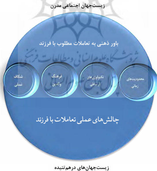
شکل شماره ۲: طرح‌واره نظری پژوهش

در طرح‌واره نظری (شکل شماره ۲) با استفاده از نیم‌دایره‌هایی برای تعریف زیست‌جهان‌های مدرن و درهم‌تنیده و دایره‌هایی برای نشان دادن عوامل تأثیرگذار بر شکاف ارتباطی والدین و فرزندان، چگونگی مسیر و فرایند آن ترسیم شده است.