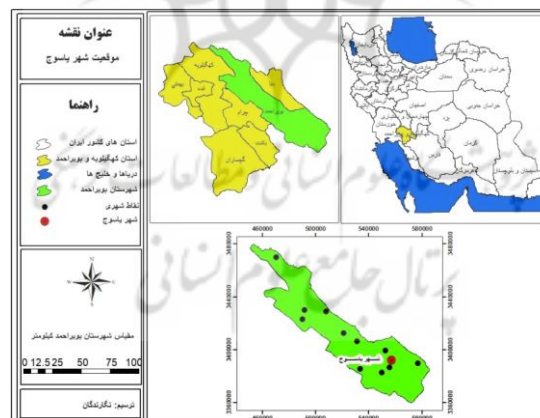
شکل (۱). موقعیت محدوده مورد مطالعه

محدوده مطالعاتی پژوهش، شهر یاسوج است. شهر یاسوج از نظر تقسیمات کشوری، مرکز شهرستان بویراحمد و همچنین مرکز استان کهگیلویه و بویراحمد است. شهر یاسوج در موقع جغرافیایی ۳۰ درجه و ۵۰ دقیقه عرض شمالی و همچنین ۵۱ درجه و ۴۱ دقیقه طول شرقی قرار گرفته است. این شهر از شمال با استان چهارمحال و بختیاری، از جنوب با استان بوشهر، از مشرق با استان اصفهان و فارس و از غرب با استان خوزستان هم‌مرز است. ارتفاع شهر یاسوج از سطح دریا، ۱۸۵۰ متر است. با توجه به ارتفاع زیاد و قرارگیری در منطقه اقلیم سردسیری، این شهر دارای آب‌وهوای معتدل و متمایل به سرد است. جمعیت این شهر از ۳۰ هزار نفر در سال ۱۳۶۵ به ۷۰ هزار نفر در سال ۱۳۷۵ و براساس آخرین سرشماری در سال ۱۳۹۵ به ۱۳۴۵۳۲ افزایش یافته است که در مقایسه با سرشماری سال ۱۳۸۵ که جمعیت آن ۱۰۸۵۰۵ نفر بوده، رشد چشم‌گیر نزدیک به ۴۰۴ درصدی داشته است.