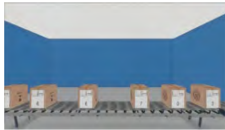
شکل ۱. ج)

شکل ۱. نمایشی از تکلیف طراحی شده در محیط واقعیت مجازی