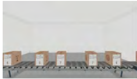
شکل ۱. الف)