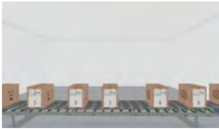
شکل ۱. ب)