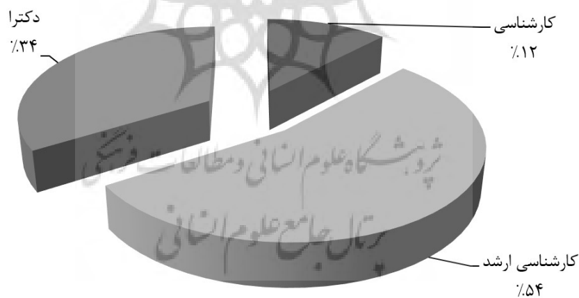
نمودار شماره (۲) تفکیک نمونه آماری برحسب تحصیلات

با توجه به جدول شماره (۴)، بیشترین افراد پاسخ‌دهنده، دارای تحصیلات کارشناسی ارشد (۵۴ درصد) و کمترین آنها، دارای تحصیلات کارشناسی (۱۲ درصد) بوده‌اند (سایر اطلاعات مربوط به تحصیلات در جدول (۴) آمده است). این ویژگی در نمودار دایره‌ای شماره (۲) توصیف می‌شود: