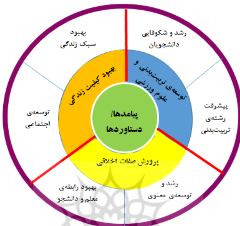
شکل ۲: خلاصه‌ی کُدگذاری محوری و انتخابی دستاوردها

با توجه به نتایج جدول ۸، از مجموع ۲۴ کُد باز مرتبط با پیامدها/دستاوردها، ۷ کُد، تشکیل‌دهنده‌ی عامل پرورش صفات اخلاقی بودند که این عامل خود از ۲ عامل محوری رشد و