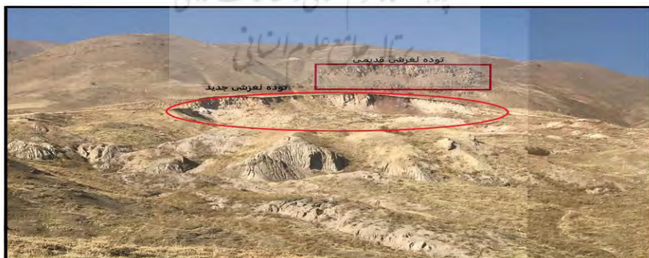
شکل شماره ۲: شناسایی ناپایداری‌های دامنه‌ای در مطالعات میدانی

همان طور که اشاره گردید، کاربرد عکاسی در علم جغرافیا بویژه در زمینه‌های آموزشی آن بسیار گسترده است؛ در ادامه به بیان نقش و تأثیر عکاسی در یکی از مهم‌ترین دروس جغرافیا یعنی روش تحقیق میدانی پرداخته می‌شود. استفاده از عکس و تصویر در درس روش و فنون میدانی در حوزه جغرافیا ابزاری بسیار مؤثر و کلیدی است که به دانشجویان این امکان را می‌دهد تا به طور مستقیم با مفاهیم و واقعیت‌های موجود در محیط‌های میدانی آشنا شوند و از تجربیات بصری بهره‌مند شوند. با استفاده از عکس و تصویر، دانشجویان قادرند به طور واقعی و دقیق منظره‌ها و محیط‌های زیست مورد مطالعه را ببینند. این امر به آن‌ها کمک می‌کند تا با ویژگی‌ها و جزئیات موجود در آن محیط‌ها، قبل از ورود به میدان، آشنا شوند و تحلیل‌های خود را با توجه به این دیدهای بصری انجام دهند. به طور کلی، استفاده از عکس و تصویر در درس روش و فنون میدانی جغرافیا، به دانشجویان کمک می‌کند تا به صورت مستقیم و با تجربه‌های بصری، با موضوعات جغرافیایی آشنا شوند و این امکان را داشته باشند که تجربیات خود را با تحلیل‌های عمیق‌تر و مفاهیمی که از مطالعه‌ی میدانی به دست می‌آورند، ترکیب کنند.