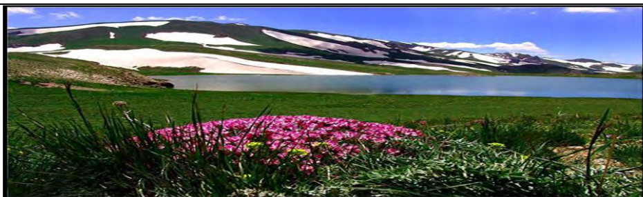
شکل شماره ۱: تصویری زیبا از دریاچه کوه دلامپر واقع در شهرستان ارومیه

همان طور که اشاره گردید، کاربرد عکاسی در علم جغرافیا بویژه در زمینه‌های آموزشی آن بسیار گسترده است؛ در ادامه به بیان نقش و تأثیر عکاسی در یکی از مهم‌ترین دروس جغرافیا یعنی روش تحقیق میدانی پرداخته می‌شود. استفاده از عکس و تصویر در درس روش و فنون میدانی در حوزه جغرافیا ابزاری بسیار مؤثر و کلیدی است که به دانشجویان این امکان را می‌دهد تا به طور مستقیم با مفاهیم و واقعیت‌های موجود در محیط‌های میدانی آشنا شوند و از تجربیات بصری بهره‌مند شوند. با استفاده از عکس و تصویر، دانشجویان قادرند به طور واقعی و دقیق منظره‌ها و محیط‌های زیست مورد مطالعه را ببینند. این امر به آن‌ها کمک می‌کند تا با ویژگی‌ها و جزئیات موجود در آن محیط‌ها، قبل از ورود به میدان، آشنا شوند و تحلیل‌های خود را با توجه به این دیدهای بصری انجام دهند. به طور کلی، استفاده از عکس و تصویر در درس روش و فنون میدانی جغرافیا، به دانشجویان کمک می‌کند تا به صورت مستقیم و با تجربه‌های بصری، با موضوعات جغرافیایی آشنا شوند و این امکان را داشته باشند که تجربیات خود را با تحلیل‌های عمیق‌تر و مفاهیمی که از مطالعه‌ی میدانی به دست می‌آورند، ترکیب کنند.