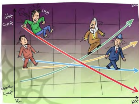
شکل ۲: نمونه‌ای از تصاویر کاریکاتوری مورد استفاده در تدریس گروه سوم.