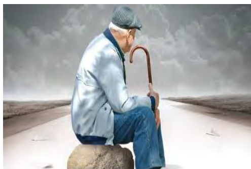
شکل ۳: نمونه‌ای از تصاویر واقعی مورد استفاده در تدریس گروه دوم.