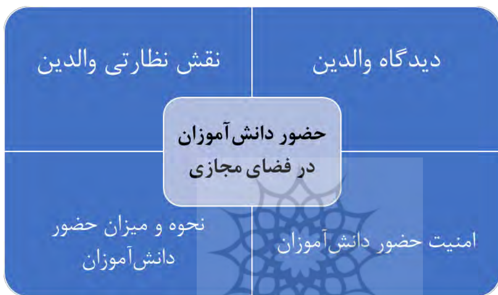
شکل ۱- مدل مفهومی نقش نظارتی والدین در امنیت دانش آموزان در شبکه‌های اجتماعی

حاکمیتی در خصوص امنیت سایبری برای پیشگیری از استثمار و سوءاستفاده از این گروه پیشرفت زیادی کرده است (Lebegue et al, 2014). تحقیق حاضر با این نگاه سعی دارد دیدگاه والدین را در خصوص حضور فرزندان دانش‌آموزان در فضای اینترنت و شبکه‌های اجتماعی را مورد بررسی و تحلیل قرار دهد. در واقع مقاله حاضر سعی دارد الگوهایی را در این زمینه شناسایی نماید. در نهایت می‌توان مدل مفهومی تحقیق حاضر را بدین صورت ترسیم نمود: