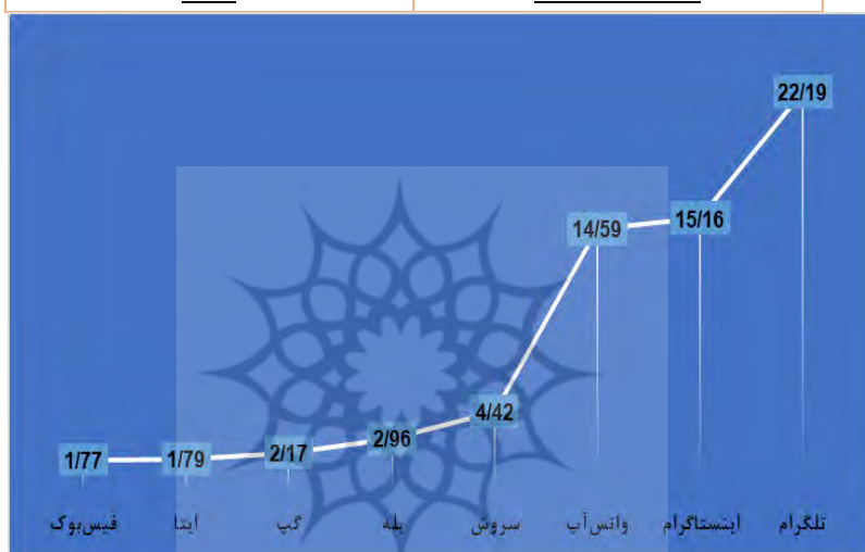
نمودار ۱- مقایسه میزان استفاده از پیام‌رسان‌ها و شبکه‌های اجتماعی

همانطور که مشاهده می‌شود در بین پیام‌رسان‌های داخلی، سروش بیشترین و ای‌تا کمترین استفاده را دارد. میانگین استفاده از این چهار پیام‌رسان داخلی نیز ۲.۸۳ از ۱۰۰ است که عدد بسیار کوچکی است. در بین پیام‌رسان‌های خارجی نیز تلگرام و بعد از آن اینستاگرام و واتس‌آپ بیشترین استفاده را دارد. میزان استفاده از فیس‌بوک نیز تقریباً نزدیک به پیام‌رسان‌های داخلی است. میانگین استفاده از چهار پیام‌رسان خارجی نیز ۱۳.۴۳ از ۱۰۰ است که این مقدار تقریباً ۵ برابر پیام‌رسان‌های داخلی می‌باشد. نمودار فوق نیز رتبه‌بندی میزان استفاده کودکان و نوجوانان از پیام‌رسان‌های مختلف را نشان می‌دهد. در ادامه رابطه بین برخی متغیرهای تحقیق مورد بررسی و تحلیل قرار خواهد گرفت.