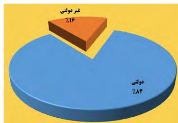
شکل ۳- توزیع درصدی مدارس براساس نوع اداره (سال تحصیلی ۱۳۹۹-۱۴۰۰) (سالنامه آماری آموزش و پرورش ۱۳۹۹-۱۴۰۰، ص ۳۳)

نکته دیگر در مورد عدالت آموزشی و افزایش امکانات از نظر ایشان، توجه به مدارس دولتی و افزایش سطح کیفی این مدارس از بُعد آموزشی و پرورشی، و رسیدگی به این مدارس است (مقام معظم رهبری، ۱۳۹۹/۰۶/۱۱). مقام معظم رهبری در سال ۱۴۰۲ مجدد بر این نکته تأکید کرده‌اند که: «تقویت مدارس دولتی مهم است. نباید در کشور جوری باشد که وقتی گفته می‌شود «مدرسه دولتی»، اولین چیزی که در مقابل انسان نقش می‌بندد، ضعف مدرسه باشد؛ این نباید باشد. معلمین خوب، مربیان خوب، مربیان تربیتی خوب، معلمین متعهد، فضاهای آموزشی قابل قبول، باید در مدارس دولتی وجود داشته باشد؛ این مطلب اول. وقتی ما به مدرسه دولتی کم‌اعتنائی بکنیم، معنایش این است که اگر کسی بنیه مالی اش آنقدر نبود که بتواند در آن مدرسه‌ای که شهریه می‌گیرد، ثبت‌نام بکند، ناچار است که تن به ضعف بدهد؛ معنایش این است که کسی که بنیه مالی ندارد، بنیه علمی هم نداشته باشد. این بی‌عدالتی محض است» (مقام معظم رهبری، ۱۴۰۲/۰۲/۱۲).