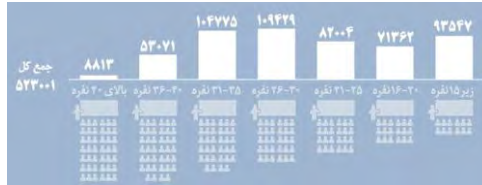
شکل ۵ - تراکم جمعیتی کلاس‌های درس و مجموع آنها (ایرنا، ۱۴۰۰)