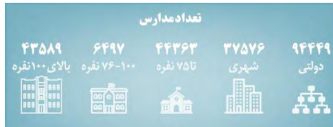
شکل ۴ - تعداد مدارس و تراکم جمعیتی کلاس‌های درس در کشور (ایرنا، ۱۴۰۰)