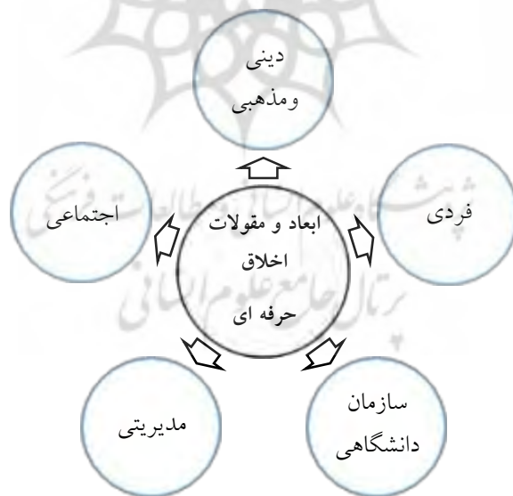
نمودار ۱- ابعاد و مقولات اخلاق حرفه‌ای دانشگاهی در بیانیه گام دوم انقلاب اسلامی

از میان تعاریف اخلاق حرفه‌ای تعریف قراملکی و همکاران را مبنا قرار می‌دهیم که چنین بود «مسئولیت‌پذیری در محیط زندگی شغلی را اخلاق حرفه‌ای می‌نامیم». در این پژوهش، از حیث عملیاتی، اخلاق حرفه‌ای در دانشگاه و مراکز آموزش عالی، به مجموعه‌ای از گزاره‌ها و ارزش‌های اخلاق حرفه‌ای بیانیه گام دوم انقلاب را در پنج مقوله اصلی اخلاق حرفه‌ای فردی، اجتماعی، دینی، سازمانی و مدیریتی در دانشگاه‌ها جمع بندی می‌شود.