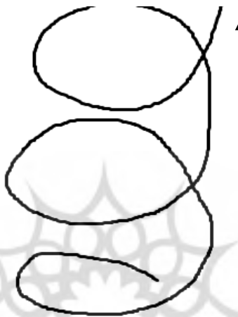
شکل ۲. الگوی پیشنهادی این پژوهش، در سطح عمودی: ماریچی و پویا

باتوجه به شکل شماره ۱، سه مرحله طرح درس، یعنی طراحی، اجرا و ارائه بازخورد به شکلی چرخه‌ای در ارتباط هستند. این نوع ارتباط چرخه‌ای بیانگر این است که هر کدام از این سه مرحله ضمن داشتن انعطاف، می‌توانند، زمینه‌ساز حرکت به سمت دیگر مراحل شوند و بنابراین در این الگو، پایانی مشخص و قاطع برای طرح درس، وجود ندارد و محتوا را به زندگی واقعی دانش‌آموز مرتبط می‌سازد. دایره وسط در شکل شماره ۱، هم هسته مرکزی تصمیم‌سازی، تصمیم‌گیری، نظارت، رهبری و کنترل و همچنین منبع تعدیل و تنظیم مراحل مختلف طرح درس پیشنهادی است. منطق مداری، شکستن سدهای عاطفی و کنش موقعیتی در واقع به طور متناظر اشاره به بهره‌گیری متناسب از سه حیطه دانشی، نگرشی و مهارتی در طراحی، اجرا، ارزشیابی و هم ارائه بازخورد دارند که در حقیقت قلب تپنده الگوی طرح درس پیشنهادی این پژوهش هستند.