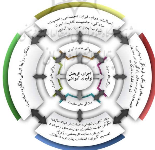
شکل شماره ۲: شبکه مضامین پژوهش براساس کدهای پایه، سازمان‌دهنده و فراگیر

به باور مشارکت‌کنندگان در این پژوهش حاضر یکی مهم‌ترین ویژگی‌های کاربران نوآوری آموزشی شبکه‌ها است. گروه‌هایی که در زمینه نوآوری آموزشی دخالت دارند یا دینفع هستند، در داخل و خارج از سازمان، باید با روابط هماهنگ و همسو با نوآوری پیش‌بروند. ماهیت و میزان انجام اقدامات متقابل بین افراد و سازمان‌ها و همچنین وجود فرصت‌های هدفمند برای تعامل بین افراد در سازمان‌های مختلف باید در راستای اجرای اثربخش نوآوری آموزشی باشد. یکی از مشارکت‌کنندگان در خصوص تأثیر شبکه‌های محیطی این‌گونه توصیف کرده است: «روابط داخل سازمان بین عناصر مختلف محیطی و همچنین با سازمان‌های دیگر اهمیت بسزایی دارد زیرا اگر روابط خوب باشد تسهیل‌گر و پشتیبان است اما اگر خوب نباشد مانع‌زا است. تمام گروه‌هایی که در داخل و خارج سازمان به وجود آمده اند همه باید با هم هم‌پیمان باشند و در یک مسیر حرکت کنند.» (بخشی از مصاحبه شماره ۷)