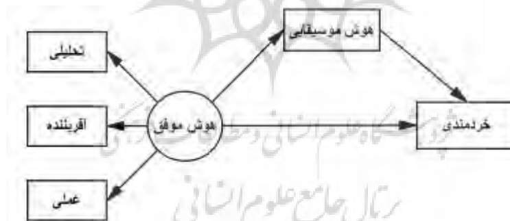
شکل 1. مدل مفهومی پژوهش

اما آنچه می‌تواند هدف مهم پژوهشی تلقی شود، بررسی مکانسیم‌های میانجی دخیل در ارتباط بین هوش موفق با خردمندی است که در این پژوهش به نقش هوش موسیقایی به عنوان یک عامل میانجی پرداخته شده است. از این رو، در اهمیت و ضرورت انجام این پژوهش و بیان مسئله این مطالعه می‌توان گفت که در مزیت خردمندی در زندگی گفته شده است که افراد خردمند، از میزان سلامت روانی و جسمانی بهتری برخوردار هستند و این خردمندی با پذیرش هر دو جنبه مثبت و منفی واقعیت به غلبه بر مشکلات زندگی کمک می‌کند که می‌تواند افراد را در زندگی صبورتر، بردبارتر و پذیرای احساسات خود و دیگران کند (کیم 2 و همکاران، 2023). همچنین می‌توان گفت خردمندی می‌تواند باعث افزایش بهزیستی روان‌شناختی (آردلت 3 و همکاران، 2023) و سازگاری افراد در زندگی شود (اِندوماتی و کنچاپاناوار 4 ، 2023). لذا انجام یک پژوهش در جهت شناخت عوامل موثر بر خردمندی به ویژه در نوازندگان پیانو دارای اهمیت و ضرورت پژوهشی است. از این رو، با توجه به موارد گفته شده همان‌طور که در شکل 1 مشخص است این پژوهش بر آن است که به این سوال پاسخ دهد که آیا هوش موسیقایی می‌تواند در رابطه بین هوش موفق با خردمندی در نوازندگان پیانو نقش میانجی داشته باشد؟ شکل 1 مدل مفهومی این پژوهش را در رابطه با مباحث مطرح شده نشان می‌دهد.