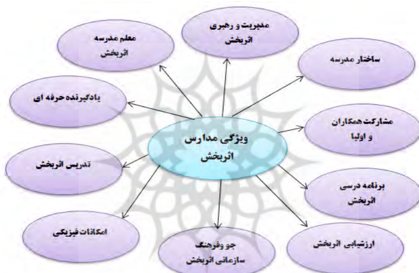
شکل شماره ۳: ویژگی‌های مدارس اثر بخش

مرحله هفتم: ارائه یافته‌ها: در گام نهایی فرآیند فراترکیب، یافته‌های حاصل از مراحل پیشین ارائه می‌گردد. در این مرحله یافته‌های حاصل از مراحل قبل در قالب یک مدل مفهومی ارائه می‌شود. در این پژوهش بر اساس نتایج تحلیل، ۱۰ مقوله کلیدی و ۶۴ کد شناسایی و آزمون کیفیت آن‌ها تأیید شد. مدل مفهومی ویژگی‌های مدارس اثر بخش در شکل ارائه گردیده است.