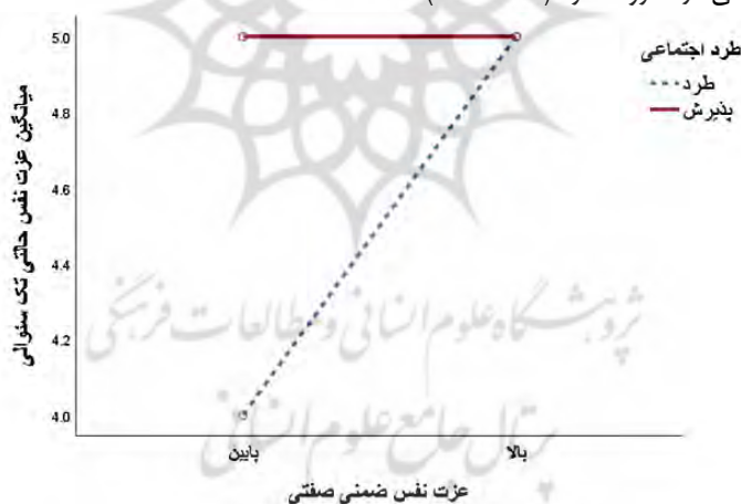
شکل ۴. نمودار تعامل عزت نفس ضمنی صفتی و طرد اجتماعی در پیش‌بینی عزت نفس حالتی تک سؤالی

به منظور بررسی تعدیلگری عزت نفس ضمنی صفتی در اثرگذاری طرد اجتماعی بر عزت نفس تک سؤالی حالتی یک روش تحلیل دیگر نیز به کار گرفته شد. در این روش ابتدا متغیر تعدیلگر یعنی عزت نفس ضمنی صفتی با برش بر روی میانه به متغیری دوسطحی تبدیل شد. سپس تحلیل واریانس دو راهه برای متغیر وابسته عزت نفس تک سؤالی حالتی با دو عامل دوسطحی (طرد - پذیرش) \times (عزت نفس بالا - عزت نفس پایین) و تعریف کردن عزت نفس روزنبرگ صفتی به عنوان متغیر همپراش اجرا شد. اثر تعاملی طرد اجتماعی و عزت نفس ضمنی صفتی معنادار بود، p = 0/014 ، F(1, 59) = 6/49 . نمودار تعامل سطح بالا و پایین عزت نفس ضمنی صفتی با سطوح مختلف طرد اجتماعی (طرد، پذیرش) در شکل ۳ نمایش داده شده است. پیگیری اثر تعاملی معنادار شده با بررسی اثرات ساده نشان داد که در سطح پایین عزت نفس ضمنی صفتی، عزت نفس تک سؤالی حالتی در گروه طرد ( M = 4/62 ) کمتر از گروه پذیرش ( M = 4/95 ) اما این تفاوت معنادار نبود، p = 0/556 ، t(30) = -0/60 اما در سطح بالای عزت نفس ضمنی صفتی، عزت نفس تک سؤالی حالتی در گروه طرد ( M = 6/22 )