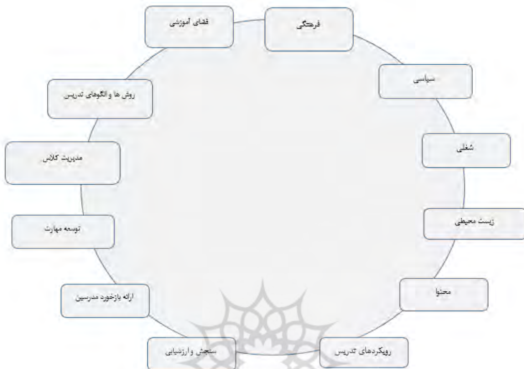
شکل ۴. مقوله های برنامه درسی آموزش عالی علمی - کاربردی

براساس ضرایب به دست آمده، مشخص شد که توسعه مهارت دانشجویان دارای بیشترین ضریب اهمیت است و بالاترین رتبه را کسب کرده است؛ یعنی در حوزه برنامه درسی آموزش عالی علمی - کاربردی این موضوع بیشتر مورد مطالعه قرار گرفته است و همچنین به ترتیب اهمیت این مقوله ها (توسعه مهارت، مدیریت کلاس، محتوا، روش ها و الگوهای تدریس، ارائه بازخورد مدرسین، فضای آموزشی، سنجش و ارزشیابی، رویکردهای تدریس، شغلی، سیاسی، فرهنگی، زیست محیطی) می باشند. شکل ۴ مقوله های برنامه درسی آموزش عالی علمی- کاربردی را نشان می دهد.