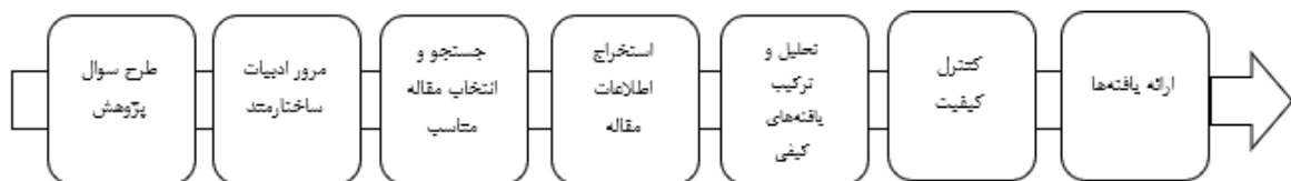
شکل ۱. فرآیند پژوهش

در این پژوهش برای فراترکیب از روش ۷ مرحله ای ساندولسکی و باروسو استفاده شده است (ساندولسکی و همکاران ۲ ، ۲۰۰۷).