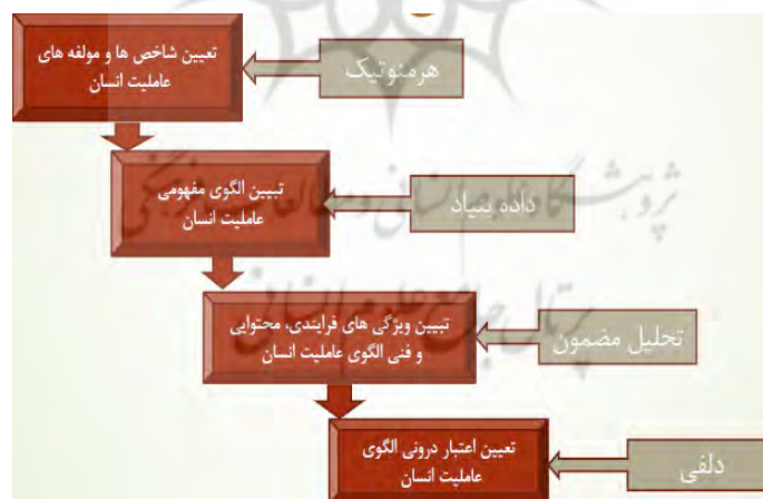
شکل ۱: روش پژوهش در یک نگاه

صل شده را با استفاده از شیوه دلفی به دست آورد. داده‌ها و یافته‌های تحقیق در اختیار پنج متخصص این عرصه قرار داده شد و میزان ارتباط شاخص‌ها با مفهوم و سازه مورد نظر ارزیابی شد و شاخص‌هایی که دارای همبستگی بالاتر از ۰/۸۵ بودند، در فرایند تحقیق قرار گرفت. شکل ۱ به طور اجمالی شیوه کار پژوهش را نمایان می‌کند.