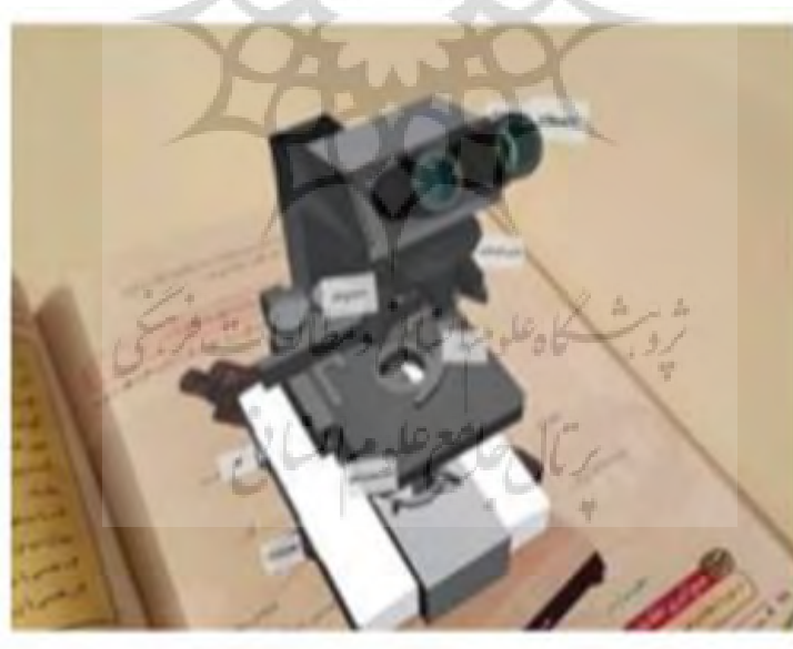
شکل ۱: مدل سه بُعدی میکروسکوپ به همراه اطلاعات اجزای آن بصورت واقعیت افزوده بر روی صفحه کتاب بارگذاری شده است