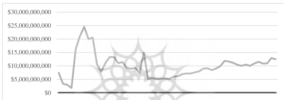
نمودار شماره (۱) برآورد تولیدات نظامی ایران طی سالهای ۱۹۷۰ تا ۲۰۲۱

همانطور که در نمودار زیر نیز قابل مشاهده است میزان تولیدات نظامی ایران بعد از شروع جنگ و اعمال تحریم های نظامی، روند رو به رشدی داشته است. همچنین دلیل بالا بودن میزان تولیدات در سال های منتهی به انقلاب اسلامی به پروژه های مشترک ایران با کشورهای دیگر همچون آمریکا و اسرائیل بر می گردد که پس از انقلاب و اتمام مشارکت در پروژه ها میزان تولیدات نیز به سرعت کاهش یافته است.