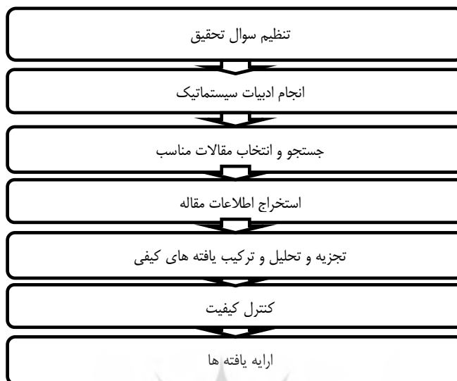
شکل شماره (۱) مراحل روش فراترکیب