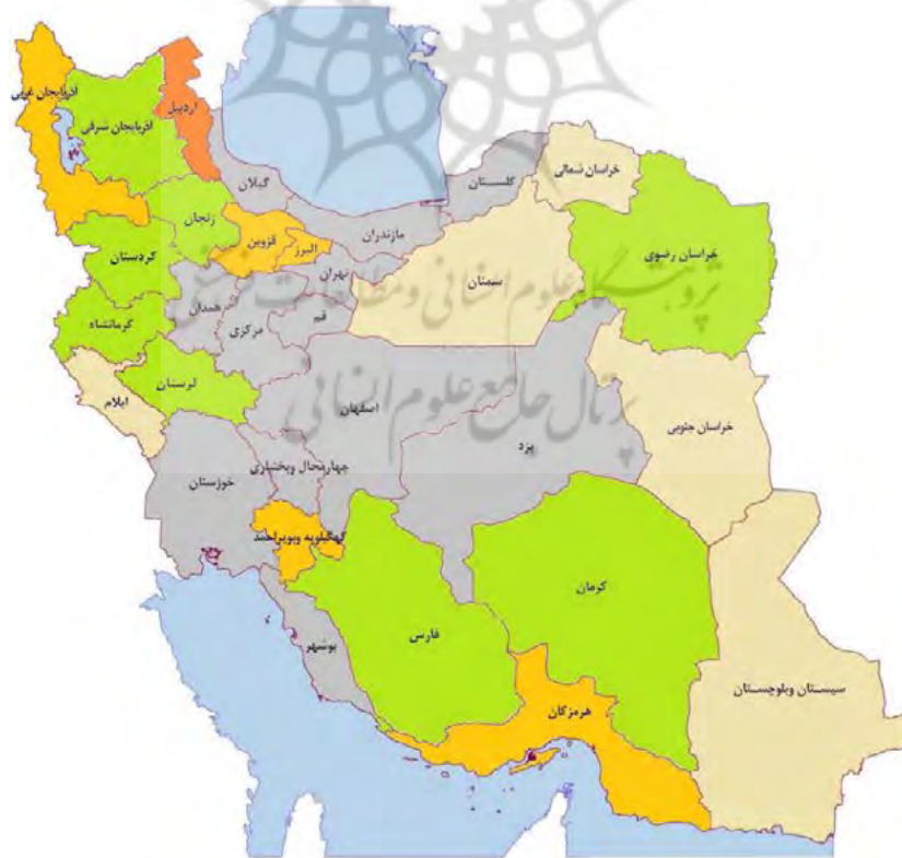
شکل ۲: نقشه الگوی مصرف غذا در مناطق شهری ایران (منبع: یافته‌های تحقیق).

با توجه به نتایج خوشه‌بندی، در شکل (۲)، نقشه مصرف مواد غذایی در مناطق شهری استان‌های مختلف کشور رسم شده است. همان‌گونه که از جدول و شکل مذکور مشخص است، الگوی مصرف مواد غذایی در مناطق شهری استان‌های مختلف کشور ناهمگون و از تنوع زیادی برخوردار است. در این خصوص، می‌توان پنج نوع الگوی رفتاری را شناسایی نمود. از سوی دیگر، به‌نظر می‌رسد الگوی مصرف مواد غذایی در مناطق شهری ایران با موقعیت جغرافیایی استان‌ها ارتباط چندانی نداشته باشد؛ به‌عنوان مثال، استان‌های واقع در خوشه دوم شامل استان‌های خراسان جنوبی، ایلام و سمنان به‌ترتیب در شرق، غرب و شمال کشور واقع شده‌اند و به‌لحاظ جغرافیایی مرز مشترکی با یک‌دیگر ندارند؛ بنابراین پرسش آن است که چه عواملی باعث بروز این تنوع نسبتاً بالای الگوی مصرف مواد غذایی در مناطق شهری ایران شده است. با این رویکرد در قسمت بعد نقش عوامل اقتصادی-جمعیت‌شناختی بر الگوی مصرف مواد غذایی در مناطق شهری ایران با استفاده از روش جورسازی بررسی شده است.