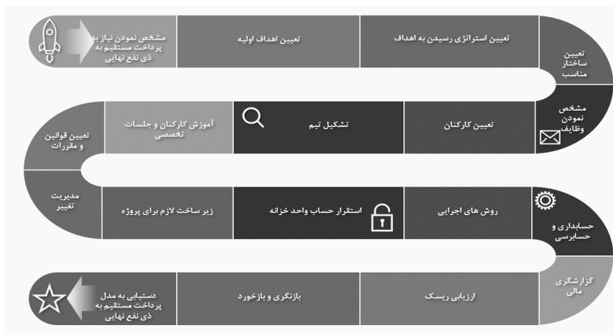
شکل ۶. نقشه راه رسیدن به مدل پرداخت مستقیم به ذی نفع نهایی