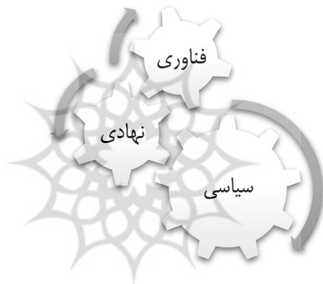
شکل ۲. عوامل مؤثر بر پرداخت مستقیم به ذی‌نفع نهایی

عوامل فناوری: در این حیطة، ممکن است راه‌حل‌های نوین فناوری اطلاعات و ارتباطات (ICT) در دسترس باشند یا به به‌روزرسانی و مدرن‌سازی سیستم‌های فعلی نیاز داشته باشد. این تغییرات می‌توانند از طریق بهره‌گیری از فناوری‌های جدید، کاربردی‌تر و کارآمدتر شوند. ممکن است تغییرات به‌صورت تدریجی و اصلاحات تدریجی یا به‌صورت جریان‌های رادیکال و پیشرفته اجرا شوند. با توجه به این تغییرات، امکان دستیابی به بهبودهای مهم در مدل پرداخت مستقیم به ذی‌نفع نهایی فراهم می‌شود (یاکوب، ۱ ۲۰۱۵).