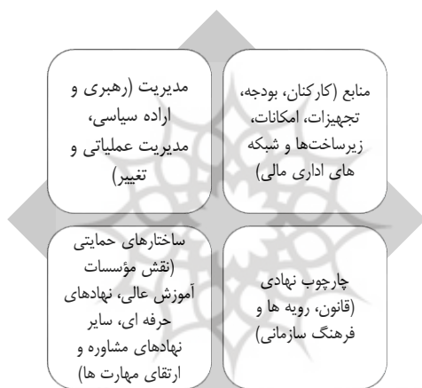
شکل ۳. چهار بعد مؤثر در ظرفیت‌سازی مأخذ: پتریوس و همکاران (۲۰۲۱)

۴. ساختارهای حمایتی: این حوزه شامل نهادهای حمایتی‌ای مانند مؤسسات آموزش عالی، نهادهای حرفه‌ای و سایر مراکز مشاوره و ارتقای مهارت‌ها است. تقویت این ساختارها از طریق ارتقای آموزش و توانمندی‌ها، بهره‌گیری از تخصص‌های حوزه‌ای و ایجاد تعاملات مؤثر با نهادهای مشابه می‌تواند در پیاده‌سازی موفق مدل پرداخت مستقیم به ذی‌نفع نهایی کمک کند.