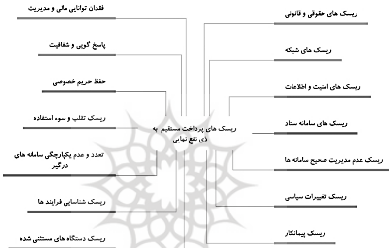
شکل ۷. ریسک‌های پرداخت مستقیم به ذی‌نفع نهایی

تطبيق مستمر برنامه براساس درس‌های آموخته‌شده نیز می‌تواند به کاهش ریسک و اثربخشی برنامه کمک کند. آنها می‌توانند اقدامات مختلفی را، از جمله فرآیندهای راستی‌آزمایی قوی، مکانیسم‌های نظارت و ارزیابی پیشرفته، طرح‌های آموزش مالی و تضمین دسترسی برای جمعیت‌های حاشیه‌نشین انجام دهند. ممیزی‌ها و ارزیابی‌های منظم می‌تواند به شناسایی و رفع هرگونه مشکل یا آسیب‌پذیری احتمالی در سیستم کمک کند.