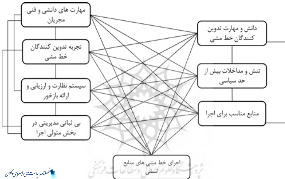
شکل ۱. الگوی اولیه اجرای خط‌مشی‌های منابع انسانی با تأکید بر قانون مدیریت خدمات کشوری

در ادامه محاسبات دلفی فازی انجام شد که براساس آن، هفت عامل با بالاترین میزان اهمیت به دست آمد: دانش و مهارت تدوین‌کنندگان خط‌مشی، مهارت‌های دانشی و فنی مجریان، تنش و مداخلات بیش از حد سیاسی، منابع مناسب برای اجرای خط‌مشی، بی‌ثباتی مدیریتی در بخش متولی اجرا، سیستم نظارت و ارزیابی و ارائه بازخور، و تجربه تدوین‌کنندگان خط‌مشی. در شکل ۱، الگوی اولیه اجرای خط‌مشی‌های منابع انسانی با تأکید بر قانون مدیریت خدمات کشوری را مشاهده می‌کنید.