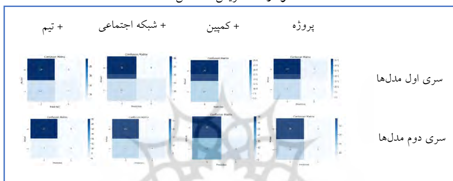
نمودار ۱. ماتریس اغتشاش

هستند که به غلط در کلاس اشتباه طبقه‌بندی شده‌اند. بر اساس مقادیر هر یک از بخش‌های چهارگانه در ماتریس‌های نمودار ۱، مدل‌ها عمدتاً در تشخیص عرضه اولیه به‌مهرهای ناموفق عملکرد بهتری از خود نشان داده‌اند و نرخ یادگیری مدل با توجه به فزونی تعداد پروژه‌های درست طبقه‌بندی شده به موارد غلط قابل قبول است. در این بین نسبت عرضه اولیه به‌مهرهای ناموفق به موفق در بخش آزمون سری مدل‌های اول و دوم به ترتیب ۰/۶۶ و ۰/۶۸ می‌باشد.