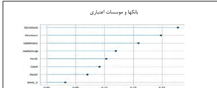
نمودار ۲. خروجی مدل‌های اجرا شده برای صنایع مورد پژوهش

اکنون براساس مدل‌های طبقه بندی ارائه شده توسط pycaret برای پاسخ به این پرسش که تفاوت تأثیرگذاری متغیرهای توضیحی بر صرف بلوک در هر یک از صنایع مختلف به چه صورت می‌باشد؛ نتایج اجرای مدل در قالب جدول شماره ۱۲ ارائه شده است.