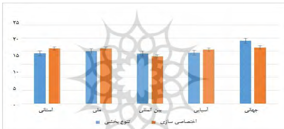
شکل ۲ مقایسه مؤلفه بسط خلاقیت در گروه های اولیه تخصصی و متنوع سازی در سطوح مختلف موفقیت ورزشی