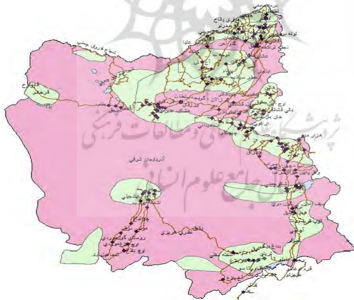
شکل ۱. نقشه قلمرو عشایر مورد مطالعه آذربایجان شرقی

با توجه به رویکرد پژوهش، جامعه مورد بررسی، عشایر استان آذربایجان شرقی می‌باشد. آذربایجان شرقی یکی از استان‌های عشایرنشین کشور می باشد که بر اساس نتایج ثبت پایه جمعیت عشایر کشور؛ در فصل قشلاق ۸۰۴۰ خانوار عشایری معادل ۳۲۴۵۵ نفر و در فصل بیلاقی ۱۴۲۱۲ خانوار معادل ۵۵۲۹۷ نفر در استان به شیوه زندگی عشیره‌ای در قالب دو ایل بزرگ قره‌داغ و شاهسون و ۹ طایفه مستقل زندگی و فعالیت می‌کنند (مرکز آمار ایران، ۱۴۰۰). قلمرو جغرافیایی عشایر آذربایجان شرقی که در مطالعه حاضر مورد بررسی قرار گرفته است در شکل ۱ مشخص شده است.