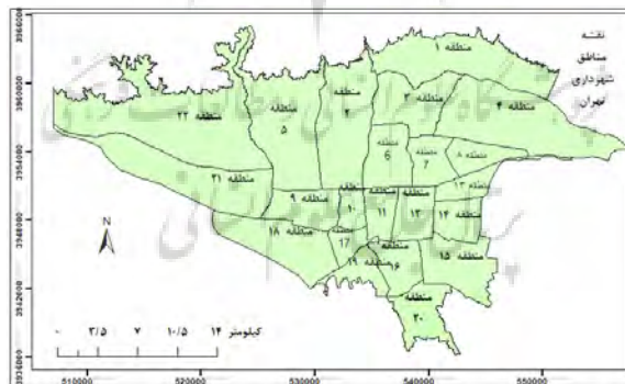
شکل ۱. محدوده جغرافیایی تحقیق

محدوده مطالعاتی تحقیق مناطق ۲۲ گانه شهرداری تهران است (شکل ۱).