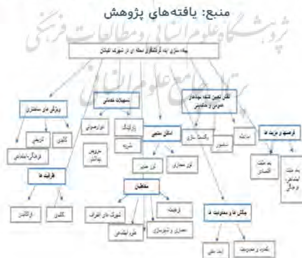
مدل ۱. شبکه مضامین عوامل دخیل در پیاده‌سازی گردشگری محله‌ای

به ارمغان آورد و در بهبود کیفیت زندگی آن‌ها تأثیر مثبت بگذارد.