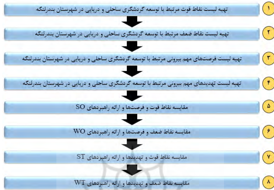
شکل ۱. مراحل تهیه ماتریس SWOT

روش تحلیلی SWOT به‌عنوان ابزاری قدرتمند برای شناسایی نقاط ضعف و قوت و همچنین شناخت دقیق تهدیدها و فرصت‌ها در محیط خارجی یک سیستم یا مجموعه می‌باشد که می‌توان به کمک این ابزار وضعیت سیستم را بررسی نمود و راهبردهایی برای کنترل آن در راستای اهداف مدنظر ارائه داد. برای اجرای این روش باید فرایند ۸ مرحله‌ای را طی کرد که در شکل ۱ تمامی مراحل ارائه شده است (موحدی و همکاران، ۱۳۹۱؛ صمد طاری و همکاران، ۱۳۹۹).