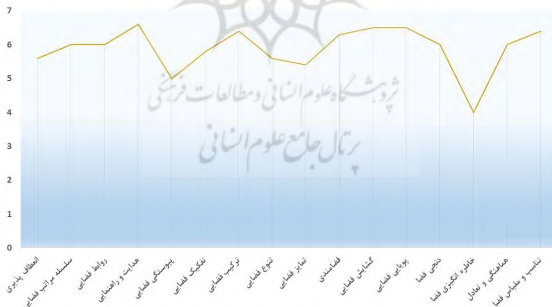
شکل ۳. امتیازدهی متخصصان به هریک از ترجیحات و ویژگی‌های فضایی خانه‌های آپارتمانی

در بخش دوم پرسش‌نامه، متخصصان به هریک از ویژگی‌های فضایی از شمار ۱ تا ۷ امتیاز داده‌اند تا میزان اهمیت هر یک از ویژگی‌ها آشکار شود. در بررسی میزان اهمیت هر یک از ویژگی‌های فضایی ترتیب میزان اهمیت از بیشتر تا کم رده‌بندی می‌شود تا ویژگی‌های پراهمیت با دیدگاه متخصصین در ترجیحات و ویژگی‌ها آشکار شود. مطابق با (شکل‌های شماره ۳ و ۴) داده‌های به‌دست آمده در