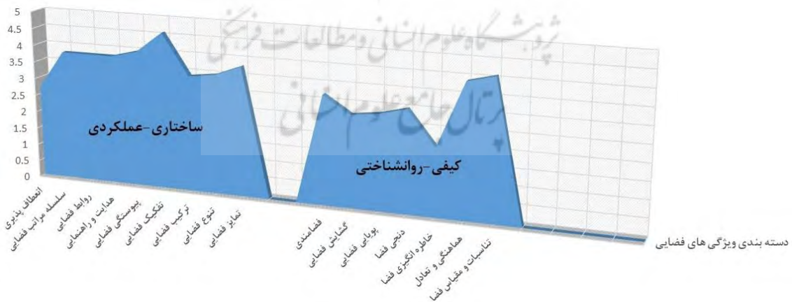
شکل ۵. سنجش جاگذاری ویژگی‌های فضایی در دسته‌بندی پیشنهادی مبانی نظری

دو دسته‌بندی پیشنهادی که در چارچوب نظری (شکل شماره ۱) ترسیم شد، در پرسش‌نامه توسط متخصصان بررسی شد تا نظرشان را در رابطه با میزان موافقت و مخالفت در جاگذاری هر یک از ویژگی‌ها به نسبت دسته‌بندی پیشنهادی اعلام نمایند؛ بنابراین، هر یک از ویژگی‌های فضایی تدقیق شده، به نسبت دو دسته‌بندی «ساختاری-عملکردی» و «کیفی-