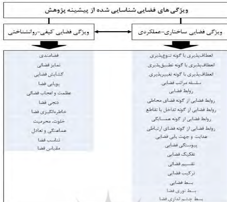
شکل ۱. دسته بندی ویژگی های فضایی مستخرج از ادبیات زمینه