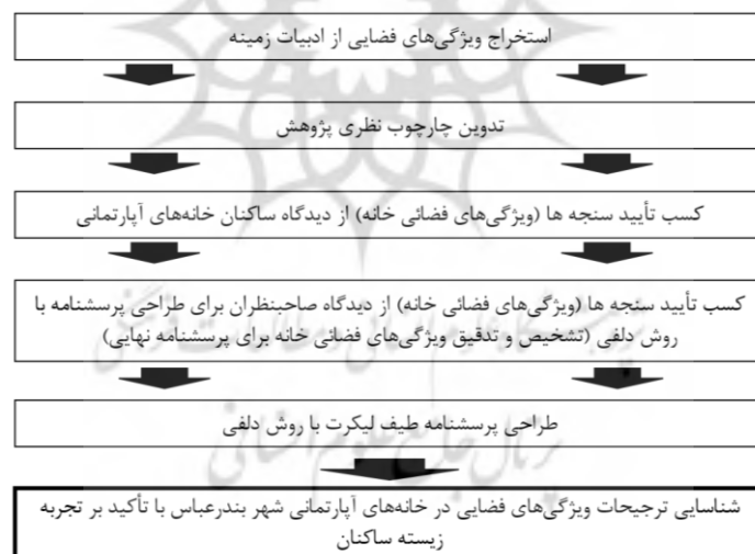
شکل ۲. فرایند تحقیق

برای طراحی پرسش‌نامه، هر کدام از شاخص‌های مندرج در چارچوب نظری تحقیق در (جدول شماره ۱)، در قالب یک گویه با پاسخ‌های چندگانه از طیف لیکرت تدوین شد. در گویه‌های مطرح‌شده، میزان اهمیت هر کدام از ویژگی‌های فضایی، موردسنجش قرار گرفت. تکنیک دلفی یکی از روش‌های تصمیم‌گیری گروهی است که برای دستیابی به توافق پیرامون مسئله موردبررسی از دیدگاه خبرگان استفاده می‌شود. هدف اصلی تکنیک دلفی دستیابی به اجماع گروهی از خبرگان است بدون آنکه خبرگان از وجود هم اطلاع داشته باشند. در رابطه با حجم نمونه بخش دلفی، هیچ توافقی برای اینکه تعداد خبرگان تکنیک دلفی چند نفر باشند وجود ندارد. با این وجود در بیشتر مطالعات ۵ تا