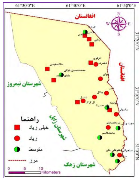
شکل ۲. چگونگی پراکنش روستاها به تفکیک شدت اثرات بادهای ۱۲۰ روزه و طوفان‌های گردوغبار بر زیست‌پذیری آنها

از سوی دیگر، به‌منظور بررسی شدت اثرات ابعاد مختلف بر زیست‌پذیری روستاهای شهرستان هیرمند، از آزمون رگرسیون خطی چند متغیره گام‌به‌گام استفاده شده است که این تحلیل تا سه‌گام پیش رفته است. با توجه به اینکه متغیر مستقل کالبدی تأثیر قابل‌توجهی بر متغیر وابسته (برآیند کلی اثرات بادهای ۱۲۰ روزه و طوفان‌های گردوغبار بر زیست‌پذیری) نداشت، به‌وسیله این مدل حذف شده است. بر اساس نتایج حاصل از اثرات متغیرهای مستقل موردتوجه، ۹۳/۱ درصد از تغییرات زیست‌پذیری روستاهای مورد مطالعه را می‌توان تبیین نمود (جدول ۷) که در این راستا، نقش بعد زیست‌محیطی در تبیین تغییرات زیست‌پذیری روستاهای مورد مطالعه بسیار بیشتر از ابعاد دیگر است (جدول ۸).