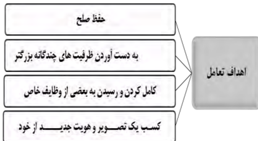
شکل ۲. اهداف تعامل از منظر کارل دویچ منبع: (Deutsch, 1988: 271).

چالش ژئوپلیتیک: ایجاد وضعیت برای یک دولت یا کشور بر پایه عوامل ثابت و متغیر ژئوپلیتیکی، چالش ژئوپلیتیک نامیده میشود که طی آن سیاست آن کشور با استفاده از متغیرها و عوامل جغرافیایی تحت تأثیر قرار میگیرد. به دیگر سخن، از رهگذر به کارگیری عوامل و ارزش‌های جغرافیایی علیه کشور رقیب، سیاست و راهبرد ملی آنها دچار انفعال می‌شود. واحدهای سیاسی برای تضعیف قدرت، منافع و مصالح کشور رقیب از عوامل و روش‌های مختلفی بهره میگیرند. عناصر و ارزش‌های جغرافیایی اعم از متغیر و ثابت، طبیعی و انسانی، مکانی و فضایی از آن دست روشها و ابزارها هستند و باعث میشوند تا بازیگر خواسته‌ها و اراده خود را بر واحدها سیاسی رقیب تحمیل کند. هدف اولیه هر چالش ژئوپلیتیکی، منفعل‌سازی طرف مقابل برای تغییر رفتار است (Hafeznia, 2006: 185).