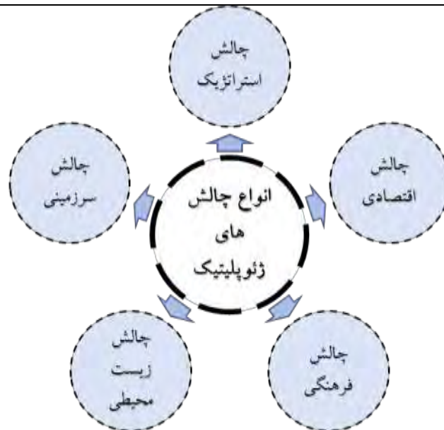
شکل ۳. انواع چالش ژئوپلیتیک (Ahmadi Nohdani et al, 2019)