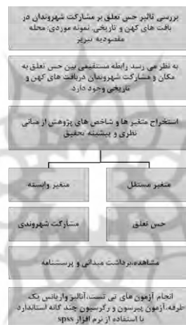
شکل ۲. دیاگرام فرایند انجام پژوهش

از آنجایی که هدف پژوهش تعیین روابط علی میان متغیر حس تعلق مکانی، و مشارکت شهروندان می‌باشد، لذا تحقیق از نظر هدف کاربردی و به روشی کمی انجام می‌شود که جمع‌آوری داده‌ها نیز به وسیله برداشت میدانی و پرسشنامه صورت می‌پذیرد. ابتدا مؤلفه‌های پژوهش با توجه به موضوع تدقیق شده و سپس شاخص‌های هر مؤلفه نیز در قالب جداولی (جدول شماره ۲) تدوین شده است. جامعه آماری مطالعه شده در این تحقیق ساکنین بالای ۱۵ سال محله مقصودیه می‌باشند. حجم نمونه با استفاده از فرمول کوکران به دست آمده است که شامل ۳۸۴ نفر از ساکنین محله مقصودیه می‌باشد و همچنین نحوه نمونه‌گیری به صورت تصادفی انجام شده است در این پژوهش اعتبار سؤالات پرسشنامه از طریق مصاحبه با ده نفر از اساتید مجرب و متخصص در حوزه شهرسازی تأیید شد. همچنین هنگام طراحی سؤالات از مدل مفهومی پژوهش که برگرفته از مطالعات نظری است، برای تأیید روایی محتوایی سؤالات استفاده شد. لازم به ذکر است به منظور سنجش پایایی نیز از روش آلفای کرونباخ بهره گرفته شد. در این پژوهش میزان پایایی تمام سؤالات پرسشنامه بالای ۰,۷ به دست آمد که بیانگر اعتبار سؤالات است.