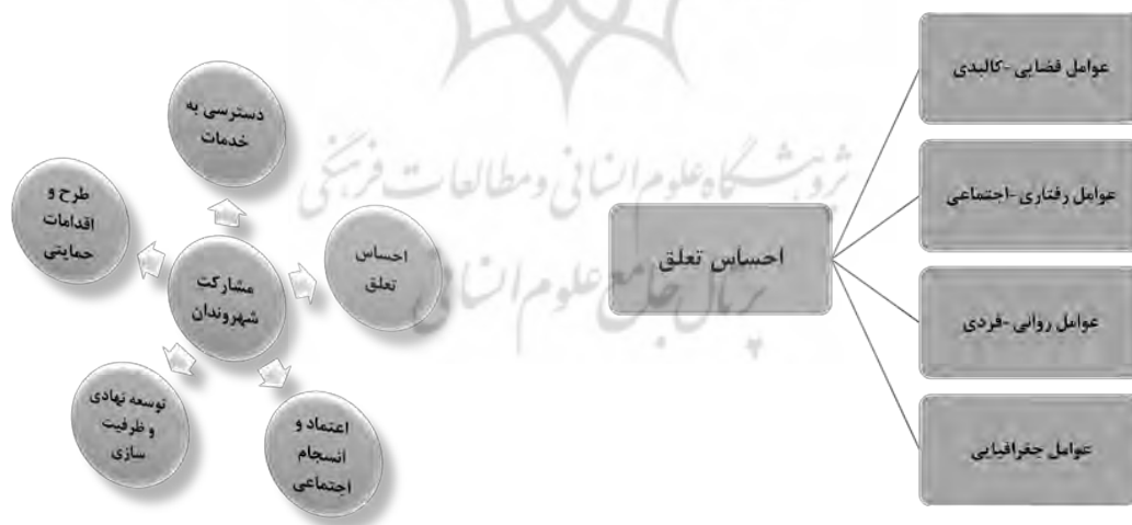
شکل ۱. مدل نظری پژوهش