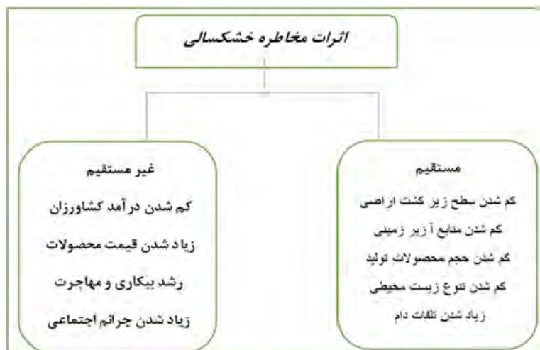
شکل ۱- اثرات مستقیم و غیر مستقیم مخاطره خشکسالی (دامن باغ و همکاران، ۱۳۹۹)

خشکسالی کشاورزی به یک تهدید مهم برای مرگ و میر شدید دام‌ها تبدیل شده است، بنابراین تأثیر منفی بر آسیب پذیری اجتماعی و انعطاف پذیری خانوارها در برابر خشکسالی کشاورزی و رویدادهای شدید دارد. محققان به ندرت ارتباط بین آسیب پذیری و انعطاف پذیری را که مفاهیم بسیار مرتبط هستند، ارزیابی می‌کنند (تی باتا ۱ و آلو مبارد ۲ ، ۲۰۲۳). تأثیر خشکسالی بر بخش کشاورزی یک تهدید حیاتی در سراسر جهان است. به طور خاص، در مناطق خشک و نیمه خشک، جنبه‌های مختلف از جمله کشت و زرع را تحت تأثیر قرار می‌دهد، جایی که باعث شکست محصول و کاهش تولید محصول می‌شود دام باعث ایجاد اختلالاتی در چرخه تولید مثلی می‌شود که به دلیل کمبود آب و غذا برای دام با میزان مرگ و میر بالا همراه است پوشش زمین و خاکی که در آن فرسایش و شوری خاک ممکن است رخ دهد (الخالیدی ۳ و همکاران، ۲۰۲۳)