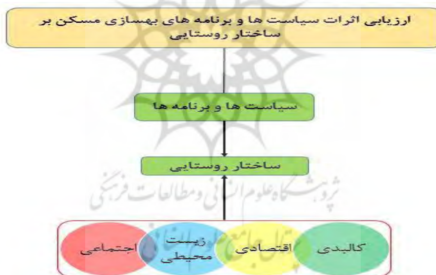
شکل ۱- مدل مفهومی تحقیق

روستایی دهستان ابریشم" نشان دادند که تحولات کمی و کیفی به وجود آمده در واحدهای مسکونی جدید در انطباق با نیاز غالب روستاییان بوده است. طرح در عین حال برخوردار از اثرات مثبت در کمیت و کیفیت مسکن روستایی، از جنبه نوع نگرش و مدیریت اجرا نیازمند بازنگری و اصلاح است. عزمی و همکاران (۱۳۹۴) در پژوهشی با عنوان "شناسایی مولفه‌های مؤثر در پایداری و بهسازی مسکن روستایی شهرستان کرمانشاه" به این نتیجه رسیدند که برای وام گیرندگان شرایط تهیه وثیقه مشکل ساز بوده، همچنین فرآیند اداری تا حدودی مشکل بوده است. در عین حال، میزان وام کم بوده است. آنها باور داشتند که عواملی همچون رضایتمندی از فرآیند تحقق بهسازی، رضایتمندی از نتیجه بهسازی، رضایتمندی از صدور مجوزها و رضایتمندی از ضمانت‌نامه‌های بانکی سبب می‌شود فرآیند دریافت وام از موفقیت بالاتری برخوردار باشد. در بین افرادی که وام نگرفته‌اند، کهولت سنی، شرایط ضمانت‌نامه‌های بانکی، نداشتن مکانی برای سکونت در زمان بهسازی و هزینه‌های اجرای طرح بهسازی از جمله موانع مردم در دریافت وام بوده است. عنابستانی و تکلو (۱۴۰۲) در تحقیقی با عنوان پیشران‌های کلیدی اثرگذار بر نظارت دهیاران بر ساخت و ساز روستایی با رویکرد آینده پژوهی شهرستان تویسرکان با استفاده از ماتریس اثرات متقاطع میک مک در افق ۱۴۱۰ مورد بررسی قرار داد و به این نتیجه رسید که عواملی از قبیل رعایت حقوق عمومی توسط مالکان در هنگام ساخت و ساز، رعایت بازده انرژی و زیر ساخت‌ها، توجه به تخصص و معماری در ساخت بنا و توجه به فرآیند صدور مجوز ساختار از مهم‌ترین عوامل اثرگذار به‌شمار می‌روند. بنابراین با توجه به مطالب گفته شد نیازمند شناخت جامع و کامل از جوامع روستایی در اجرای طرح بهسازی مسکن روستایی لازم است.