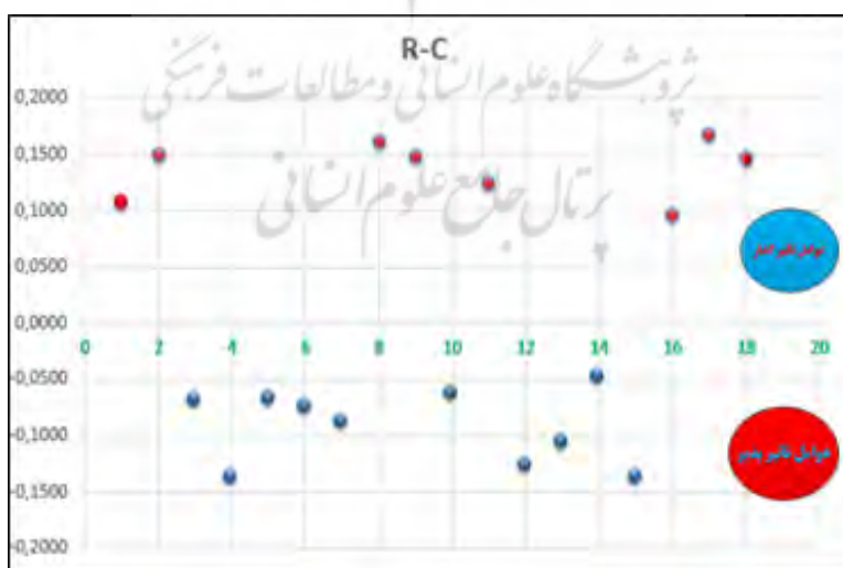
شکل ۱. ماتریس تأثیرپذیری و تأثیرگذاری عوامل مؤثر بر توسعه پایدار گردشگری روستایی

R+C (بُردار برتری) بیانگر مجموع تأثیرگذاری و تأثیرپذیری عامل موردنظر و R-C (بُردار ارتباط) بیانگر اثرگذاری هر عامل بر مجموعه دیگر عوامل است؛ به بیان دیگر، اگر باشد، عامل یا معیار تأثیرگذار است و متغیر علت محسوب می‌شود و اگر باشد، عامل یا معیار تأثیرپذیر است و متغیر معلول محسوب می‌شود. با توجه به مقادیر R+C و R-C ماتریس تأثیرپذیری و تأثیرگذاری عوامل در شکل ۱ ارائه شده است: