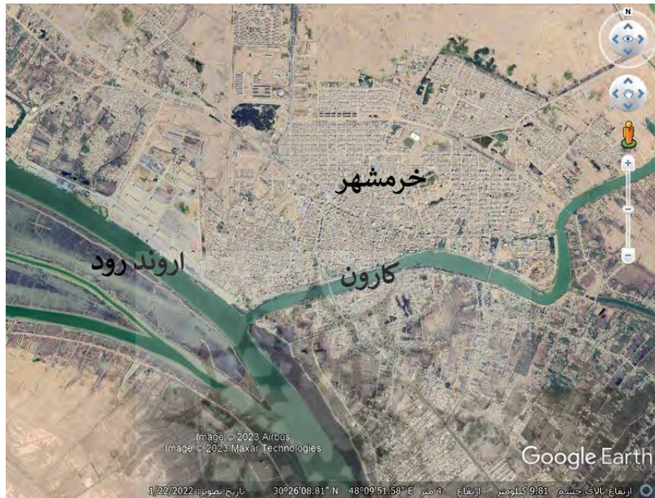
شکل ۲: تصویر ماهواره‌ای شهر خرمشهر که در کنار رودخانه‌های کارون و اروندرود قرار دارد

شهرهایی مانند حمیدیه داشته است. با توجه به موارد مذکور، رودخانه‌های استان خوزستان از جمله مهم‌ترین عوامل طبیعی هستند که در استقرار، توسعه فیزیکی و جهت توسعه شهرهای استان خوزستان نقش داشته‌اند.