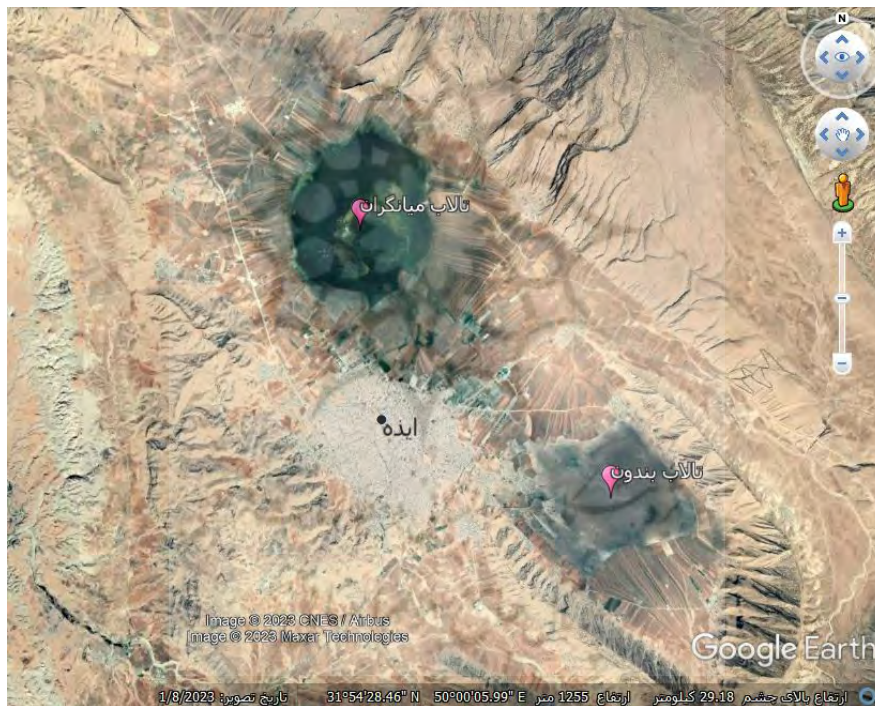
شکل ۴: تصویر ماهواره‌ای شهر ایذه در بین دو تالاب میانگران و تالاب بندون

تالاب‌ها از جمله اکوسیستم‌هایی هستند که بسیار مورد توجه قرار می‌گیرند. تالاب‌ها با توجه به گونه‌های ارزشمند گیاهی و جانوری و همچنین وضعیت هیدرولوژی که دارند، از عوامل جاذب جمعیت محسوب می‌شوند. بررسی‌های انجام شده نشان داده است که در استان خوزستان تالاب‌های مهمی مانند هورالعظیم، تالاب شادگان، تالاب بندون و تالاب میانگران وجود دارد که هر کدام از آن‌ها در استقرا، توسعه فیزیکی و جهات توسعه شهرهای استان خوزستان نقش موثری داشته‌اند. به طور مثال، شهر ایذه در بین دو تالاب بندون و میانگران قرار دارد (شکل ۴) و همین مسئله در استقرار و توسعه یافتگی این شهر نقش مستقیمی داشته است.