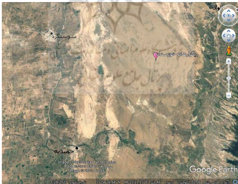
شکل ۵: نمایی از ریگزارهای جلگه خوزستان

ریگزارها از جمله لندفرم‌های محدودکننده هستند که در بخش‌های مرکزی، جنوبی و شرقی کشور و همچنین در جلگه خوزستان وجود دارند. ریگزارها مانعی در برابر توسعه فیزیکی شهرها محسوب می‌شوند و در جلگه خوزستان نیز این ریگزارها علاوه بر ایجاد آلودگی‌های زیست‌محیطی و تشکیل کانون‌های گردوغبار، مانعی در برابر توسعه فیزیکی سکونتگاه‌ها هستند. ریگزارهای استان خوزستان در بخش‌های میانی این استان قرار دارند و نقاط شهری این استان، به دور از این ریگزارها هستند، بر این اساس می‌توان گفت که ریگزارها نقش مهمی در مکان‌گزینی شهرهای این منطقه داشته‌اند. در شکل ۵ نمایی از ریگزارهای جلگه خوزستان نشان داده شده است.