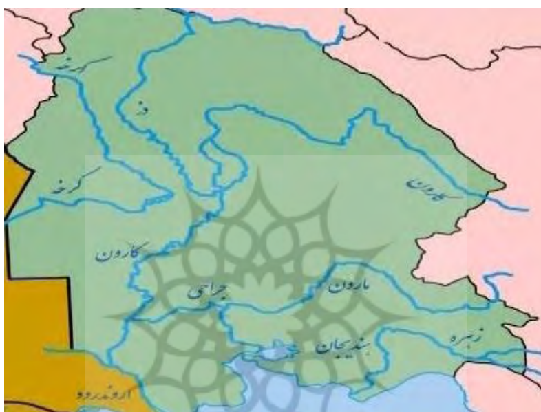
شکل ۱: نقشه رودخانه‌های اصلی استان خوزستان

استان خوزستان از جمله استان‌هایی است که دارای منابع آب سطحی زیادی است. این استان دارای رودخانه‌های دائمی زیادی است که این رودخانه نقش اصلی را در شکل‌گیری سکونتگاهی آن داشته است. در استان خوزستان رودخانه‌های مهمی مانند کارون، کرخه، زهره، مارون و جراحی وجود دارد (شکل ۱) که نقش اصلی را در توسعه فیزیکی و جهات توسعه شهرهای این استان داشته‌اند.