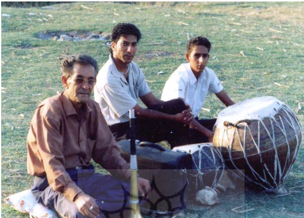
عکس ۴) موسیقی محلی فارس