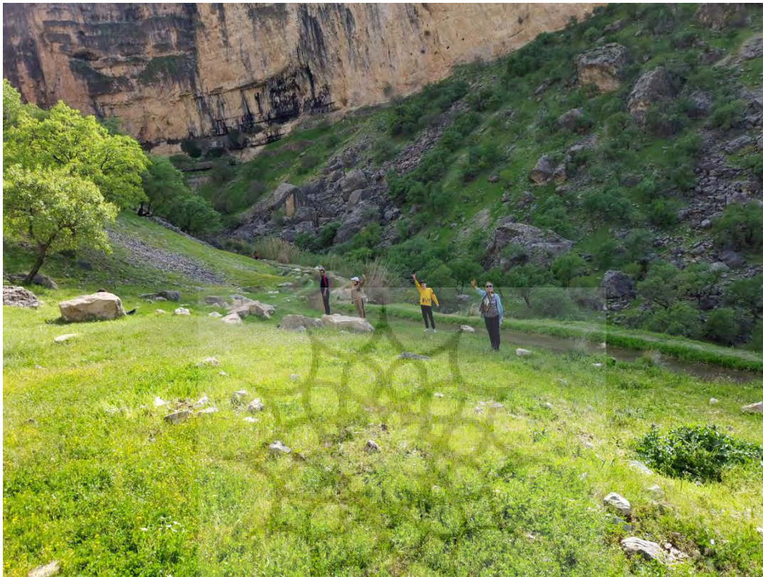
عکس ۶) موسیقی سکوت در دامنه‌های زاگرس / تنگ سا نورآباد فارس

تموم نشدنی از این حیث وجود دارد به همین دلیل بیشتر گردشگران که خواهان لذت‌جویی راز بقا و فضای اکوتوریسم هستند به این قاره سفر می‌کنند.