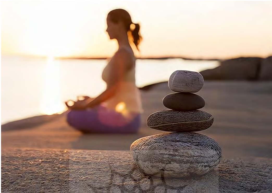
عکس ۵) موسیقی رهایی