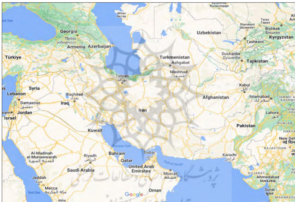
نقشه ۱) موقعیت سرزمینی و دریایی ایران

متخصص در جایگاه شغلی قدرت سیاسی و یا فقدان اراده سیاسی قوی برای پیشبرد چنین استراتژی توسعه‌ای، باعث شده تاکنون از این طریق، ایران کنونی وارد چرخه تبادلات و شبکه‌ای نشود و به سمت توسعه نرود. نسخه‌ی تجویزی جغرافی دانان ایران استفاده از چنین مناطقی در راستای توسعه‌مندی است. با نگاهی به نقشه ایران می‌توان مناطق دریایی ایران را که می‌توانند گفتمان صلح را از طریق گردشگری و موسیقی پیش ببرند را دید و با مقایسه پیکره تنی / سرزمین ایران و استفاده درست از آن عضو که مناطق دریایی است توسعه و صلح را برای ایران کنونی بدست آورد.