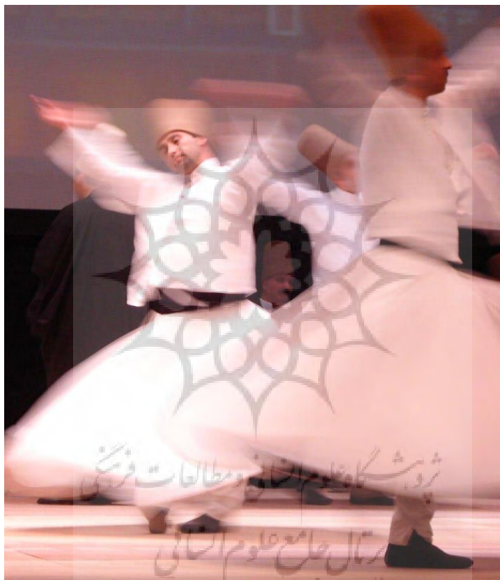
عکس ۷) موسیقی درون

را پیش می‌برند و در فرایند تصمیم‌گیری چندان معتقد به عقل/مغز نیستند. با استناد به اینکه طبیعت/زمین/جغرافیا، بدن است و تنوع و خلقت شگفت‌انگیز این بدن در درون جغرافیای بدن انسان نیز هست برخی، چنین شگفتی را در درون خود جستجوی می‌کنند تا پی به خویشتن ببرند. این نوع موسیقی در تمدن شرق بیشتر دیده می‌شود به ویژه برای آن دسته از گردشگرانی که در پی کنار گذاشتن گرایش‌های نفسانی هستند و توجه به مراکز انرژی در بدن دارند (چاکرا) مورد توجه است. حالات خلسه روحانی و نیایش، تجربه خروج از بدن، وجد، رویاپردازی، درون‌پویی، ذهن‌آگاهی و فراآگاهی در این نوع از موسیقی جای دارد.