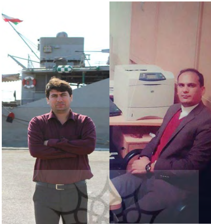
عکس ۱) تئوری پردازان تمدن دریایی گردشگری و موسیقی