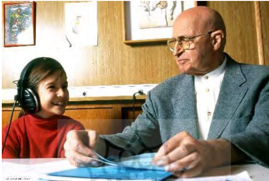
عکس ۳) پرفسور آلفرد توماتیس

است نه تنها دچار کم‌شنیدن می‌شود بلکه چیزهای دیگری را هم از دست می‌دهد (راديو فردا، ۱۱ اردیبهشت ۱۳۸۴).