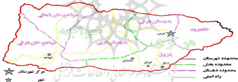
شکل ۲: نقشه شهرستان هریس

شهرستان هریس یکی از شهرستان‌های استان آذربایجان شرقی است که از دو بخش مرکزی و خواجه تشکیل شده است و با وسعت ۲۳۴۵ کیلومتر مربع در ۶۰ کیلومتری تبریز واقع شده است. جمعیت این شهرستان طبق سرشماری سال ۱۳۹۵ بالغ بر ۶۹۰۹۳ نفر است. مرکز این شهرستان، شهر هریس می‌باشد. شهرستان هریس از سمت شرق به شهرستان‌های سراب و مشگین شهر، از سمت غرب به شهرستان تبریز، از سمت شمال به شهرستان‌های ورزقان و از سمت جنوب به شهرستان بستان‌آباد محدود شده است. از نقاط دیدنی این شهرستان می‌توان به آب معدنی اکوزداغی، امامزاده ابواسحاق، دربند هرزه و رز، میدان قلعه‌بوری، چشمه سوقالخان، منطقه گردشگری سابلاق، تپه دوزده باغیرزنق، گورستان مینق، سد پارام، سد ارباطان و روس قلعه‌سی، پل تاریخی و نیار، برج دیده‌بانی بخشایش اشاره کرد. نیروگاه سیکل ترکیبی هریس از منابع انرژی در این منطقه است. مرغوب‌ترین و معروفترین فرش پشمی آذربایجان در شهرستان هریس بافته می‌شود در چند سال اخیر جاده جدیدی ۵ کیلومتر بعد از خواجه راه اصلی اهر-تبریز را به هریس متصل می‌کند جاده قدیمی نیز کماکان دایر است فاصله هریس تا تبریز حدود ۶۷ کیلومتر است.