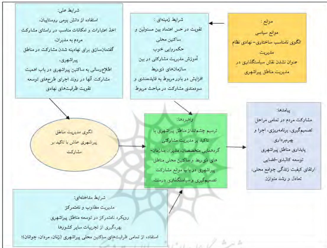
شکل ۳. الگوی مدیریت مناطق پیراشهری خاش با تأکید بر نقش مشارکت

همانطور که در جدول (۴) ملاحظه می‌شود، در بین راهبردهای مطرح‌شده: تصمیم‌گیری و سیاست‌گذاری درست با مقدار ۰/۴۰۰، در پیامدها: پایداری مناطق پیراشهری با مقدار وزن ۰/۲۷۷، در موانع: الگوی نامناسب ساختاری- نهادی نظام مدیریت با مقدار وزن ۰/۳۵۶، بیشترین اهمیت را در مدیریت مناطق پیراشهری خاش به خود اختصاص داده است. سپس در شکل (۳)، الگوی کدگذاری (مدل پارادایمیک) تئوری داده بنیاد برای شرایط علی، زمینه‌ای، مداخله‌گر، راهبردها، پیامدها و موانع مدیریت مناطق پیراشهری با تأکید بر نقش میانجی‌گری مشارکت نشان داده‌شده که حاصل کدگذاری محوری و نظریه‌پردازی مفاهیم و مقوله‌های حاصل از مصاحبه‌های پژوهش حاضر است.