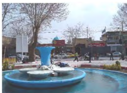
Figure 3. A View of the Previous (Right) and Current (Left) Condition of the Sabze Meydan Footpath in Zanjan City

وضعیت ارجحیت بوده است. در مراتب بعدی کیفیت مبلمان و تجهیزات و تقویت عناصر خاطره‌انگیزی با توجه به موقعیت قرارگیری سبزه‌میدان شهر زنجان در بافت مرکزی شهر در کنار عناصر تاریخی و میراثی شهر با وزن ۰/۰۶۱ در رتبه دوم تا سوم قرار گرفته‌اند. در سطح بعدی تقویت فضاهای جمعی و تسهیل دسترسی با وزن‌های ۰/۰۶ و ۰/۴ در رتبه‌های ۵ و ۷ جای گرفته‌اند.