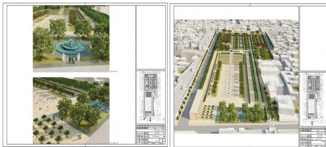
شکل ۲. پلان نهایی سبزه‌میدان شهر زنجان (Zanjan Municipality., 2019)

امروزه محله سبزه‌میدان مرکزیتی مکانی اجتماعی و اقتصادی در بافت شهر دارد و از نظر موقعیتی تقریباً در مرکز فیزیکی شهر است. بخش حکومتی به‌طور کامل تخریب شده است و به‌جز چند تک‌بنای تاریخی، یعنی عمارت دارایی و عمارت ذوالفقاری نشان‌های از بافت تاریخی در مجموعه مشاهده نمی‌شود (Habibi et al., 2008:56). این فضا میراث ارزشمند تاریخی با قدمت چند صدساله است که طرح تملک آن از سال ۱۳۶۸ آغاز شده است. همچنین محدوده‌ای حدود ۷/۵ هکتار در ورودی ضلع شمالی بازار تاریخی زنجان واقع شده است که این محدوده پس از وقفه چندین ساله با تدابیر مدیریت استان و شهرداری و شورای اسلامی شهر در سال ۱۳۹۲ (بهمن‌ماه) طی فراخوانی عمومی و ملی، برای شناسایی و انتخاب سرمایه‌گذار انتخاب شد و در نهایت شرکت