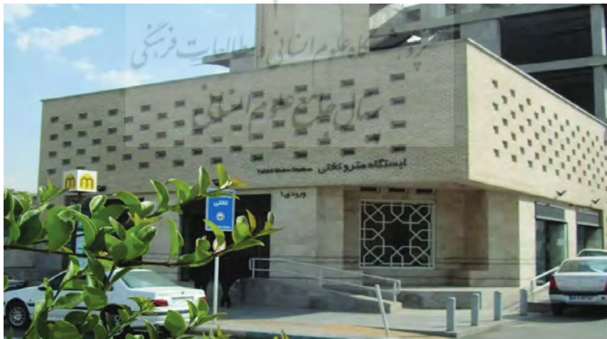
تصویر شماره (۱): ایستگاه متروی تختی