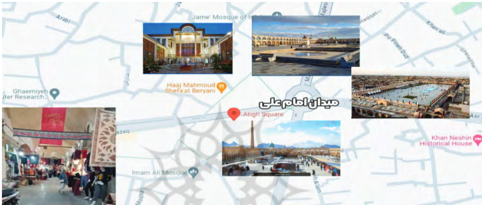
نقشه شماره (۲): محدوده مورد مطالعه در اصفهان (محله سبزه میدان)