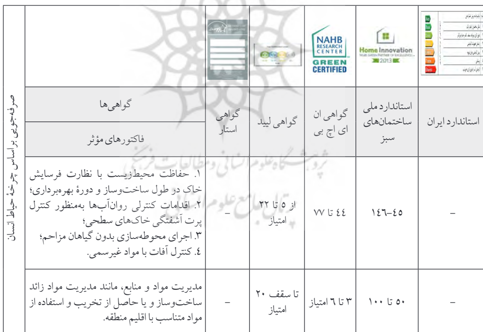
جدول شماره (۸): مقایسه امتیازهای در نظر گرفته شده برای گواهی ممیزی انرژی ایران و گواهی‌های شورای ساختمان‌های سبز براساس فاکتورهای مؤثر بر صرفه‌جویی براساس چرخه حیات