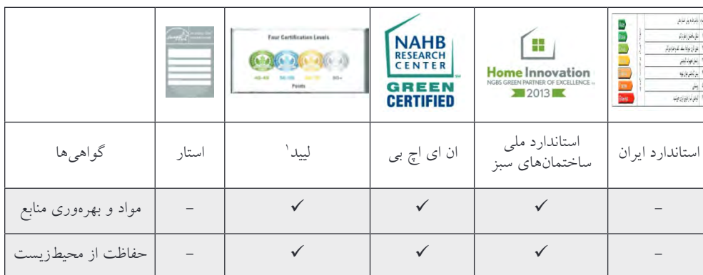
جدول شماره (۷): مقایسه گواهی ممیزی انرژی ایران براساس مؤلفه‌های مؤثر در صرفه‌جویی براساس چرخه حیات نسبت به گواهی‌های مورد تأیید شورای ساختمان‌های سبز