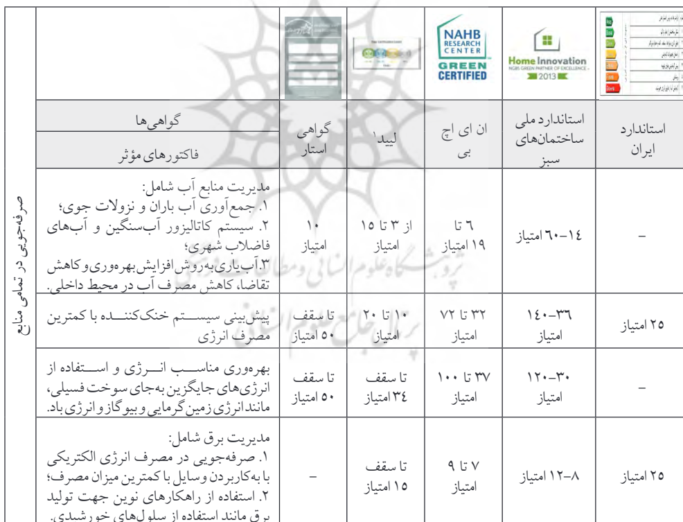
جدول شماره (۶): مقایسه امتیازهای در نظر گرفته‌شده برای گواهی ممیزی انرژی ایران و گواهی‌های شورای ساختمان‌های سبز بر اساس فاکتورهای مؤثر بر صرفه‌جویی در تمام منابع

مأخذ: نگارندگان با توجه به مطالعات کتابخانه‌ای