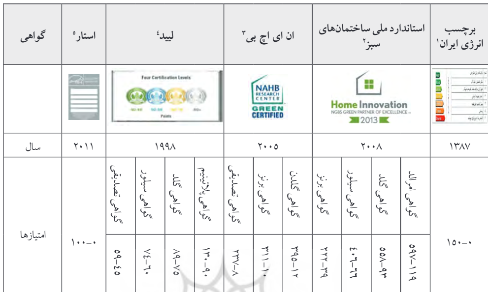
جدول شماره (۲): جدول امتیازی هر یک از گواهی‌های ساختمانی براساس توجه به نیازهای انسانی

مأخذ: نگارندگان با توجه به مطالعات کتابخانه‌ای