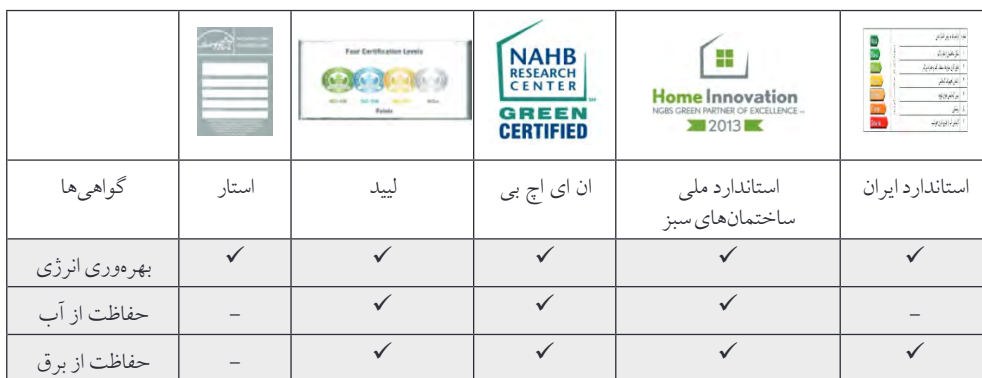
جدول شماره (۵): مقایسه گواهی ممیزی انرژی ایران بر اساس مؤلفه‌های مؤثر در صرفه‌جویی در تمام منابع نسبت به گواهی‌های مورد تأیید شورای ساختمان‌های سبز