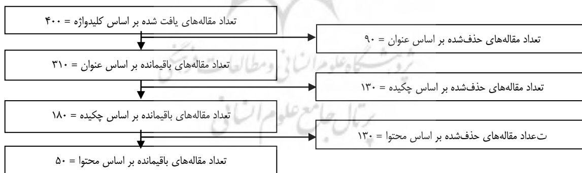
شکل ۲. نتایج جست‌وجو و انتخاب متون

در این مرحله، به بررسی تناسب موضوع مقاله‌های پیداشده با هدف و سؤال پژوهش پرداخته شد. بدین منظور، مجموعه مقاله‌های منتخب چندین بار بازبینی شدند و در هر بازبینی، چند مقاله حذف شد. در فرایند جست‌وجو، پارامترهای مختلفی مانند عنوان، چکیده و محتوا در نظر گرفته شد و مقاله‌هایی که به لحاظ پارامترهای مذکور با سؤال و هدف پژوهش تناسبی نداشت، حذف شدند. در نمودار شماره ۳ مراحل اجرای این روش و انتخاب منابع ارائه شده است.