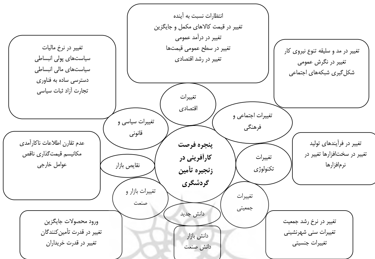
شکل ۳. پنجره فرصت کارآفرینی در زنجیره تأمین گردشگری

پیشنهاد می‌شود با توجه به اینکه در این مقاله به تبیین و شناسایی پنجره‌های فرصت در زنجیره تأمین صنعت گردشگری پرداخته شده است محققان در پژوهش‌های آتی به رتبه‌بندی مقوله‌ها و مفاهیم با استفاده از روش‌های AHP، ANP و غیره بپردازند. از آنجاکه این پژوهش به صورت کیفی و با رویکرد فراترکیب انجام شده است، به محققان بعدی پیشنهاد می‌شود که با در نظر گرفتن جامعه آماری خاص، مدل را با روش‌های کمی همچون مدل‌سازی معادلات ساختاری برآزش کرده و میزان همبستگی ابعاد و شاخص‌های آن را بررسی کنند. همچنین تحقیقات آینده می‌توانند با بررسی بیشتر منابع، سایر کدها و مؤلفه‌ها را در صورت وجود شناسایی کنند.